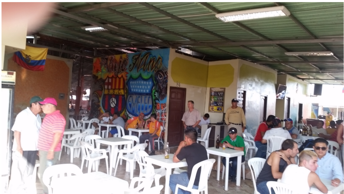
El establecimiento La Puentecita es el más grande en la provincia.