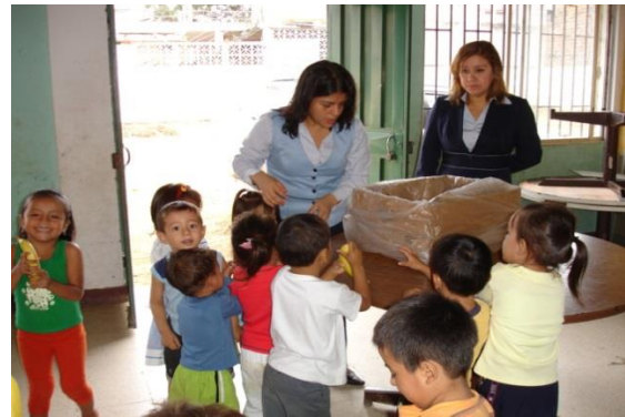
Gráfico N°4 Beneficiarios niños del INNFA

Como se puede observar en los gráficos anteriores la ayuda social es principio básico del comercio justo, es por ello que a través de la investigación se conocerá si este rubro ha sido utilizado de la manera correcta o demostrara la forma de seguir con estos proyectos.