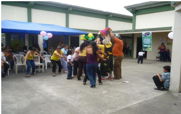
Gráfico N°3 Beneficiarios de Fundación Cariño

A continuación se demuestra algunas ayudas sociales que ha desarrollado la asociación Cerro Azul con el rubro de la prima de comercio justo: