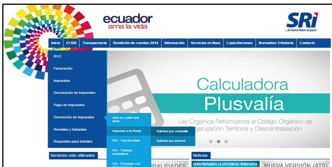
2 grafico: página de inicio del portal del servicio de rentas internas

Ya obteniendo los documentos necesarios para realizar la devolución se procederá al planteamiento del trámite de la devolución.