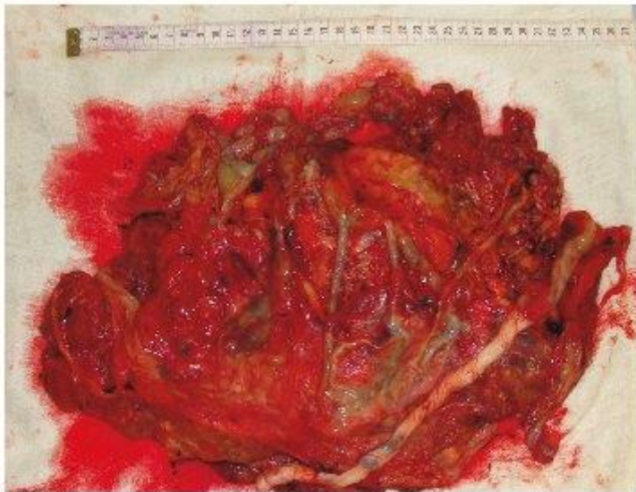
Figura 1. Placenta. Macroscopía:

La placenta midió 55 cm x 35 cm, de 19 cm de diámetro, con peso de 1266 gr. En la cara fetal membrana amnio coriónica única, ( Fig. 1 ) flexible y blanda, cordón umbilical de inserción excéntrica, con tres vasos permeables; En la cara materna, presenta una zona con cotiledones de aspecto normal y en un extremo múltiples estructuras vesiculares, ( Fig. 1 ) con contenido citrino al corte, con diámetro de 0,4 - 1 cm, sugiriendo el diagnóstico de mola parcial.