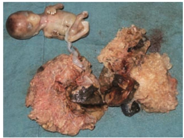
Figura 5. Feto y placenta