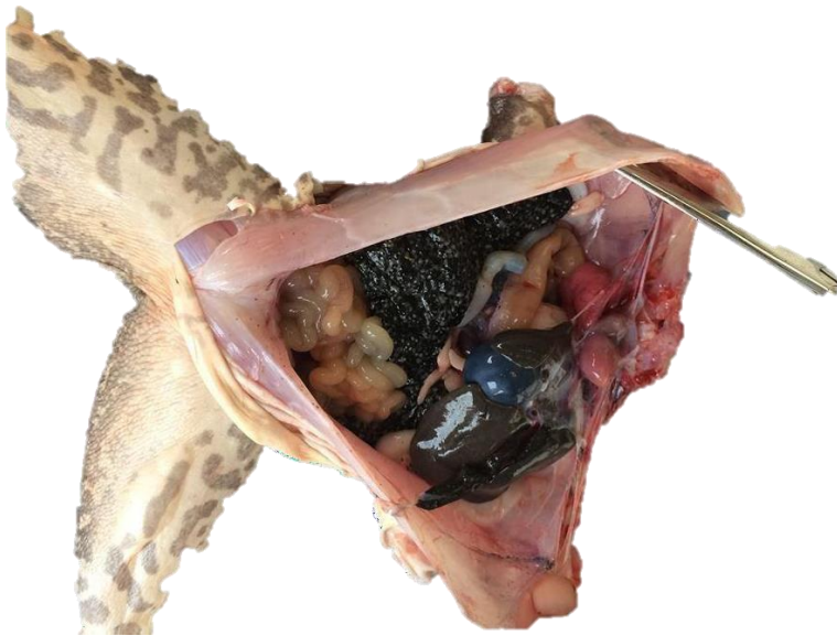
Ilustración 7. Exposición de los órganos de la Rana Toro