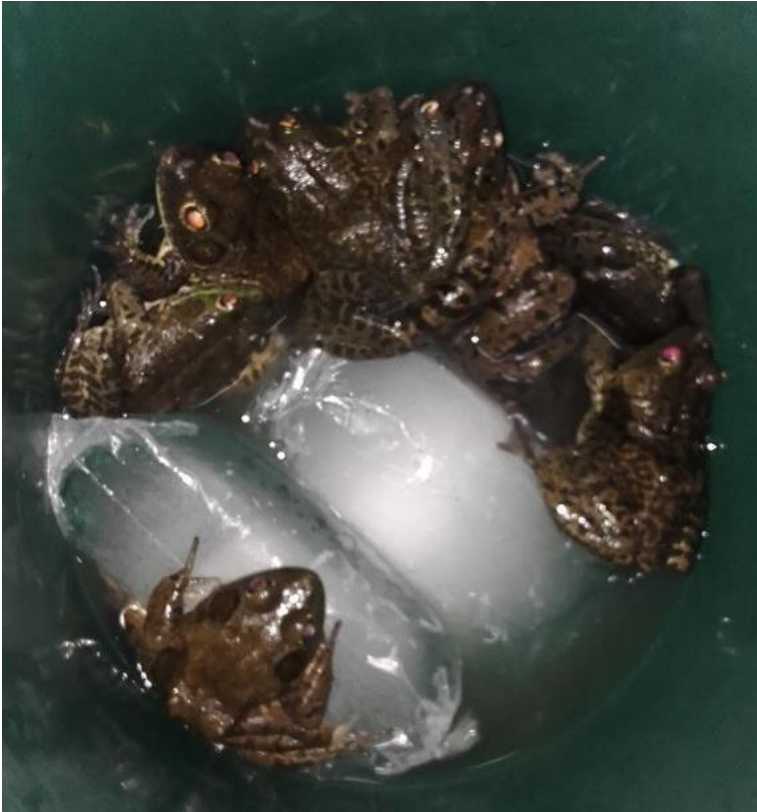
Ilustración 5. Rana Toro capturadas

La Estación Piscícola Cacharí – Babahoyo se encuentra ubicado en un terreno de 5,86 hectáreas de la Universidad técnica de Babahoyo, y cuenta con dos laboratorios, oficinas, sala de capacitación y un área externa con 20 piscinas y canales de distribución de agua, para mantenimiento de reproductores y prole en producción a gran escala y de manera constante, se estableció que la captura se realizaría los días martes, jueves y sábados, las capturas se hacían en las tardes.