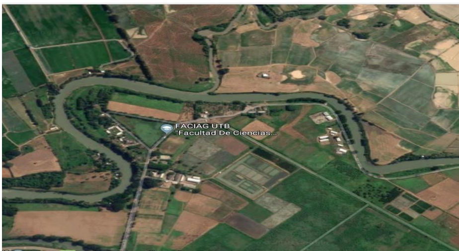
Ilustración 2. Localización georeferencial sector- Babahoyo

2.- Estación Piscícola Cacharí – Babahoyo, “Granja Experimental San Pablo” de la Facultad de Ciencias Agropecuarias, Escuela de Medicina Veterinaria y Zootecnia de la Universidad Técnica de Babahoyo, ubicado en el km 7.5 vía Montalvo, es una zona de clima tropical, humedad relativa 89%, cuya localización geográfica es 1°47'50.46'' S latitud y una longitud 79°28'56.33' O, con una temperatura promedio de 25°C. (Ilustración 2).