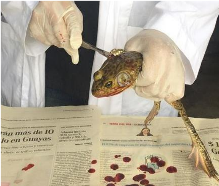
Ilustración 6. Desangrado de la Rana Toro