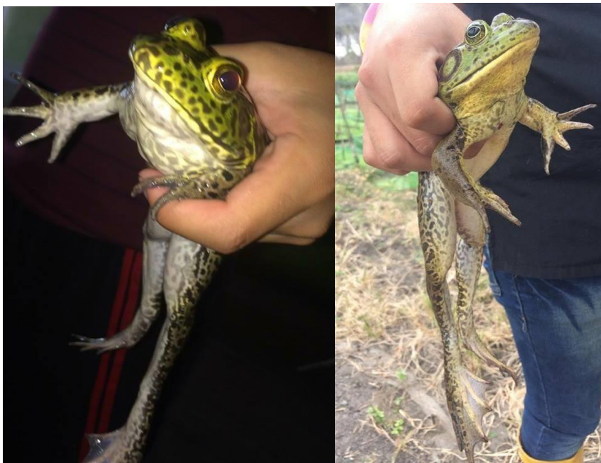
Ilustración 3. Rana Toro capturada – sexo hembra / macho

producción de alevines Yaguachi la misma que cuenta con una extensiva vegetación a sus alrededores y un total de 10 piscinas y estanques para la producción de tilapia donde cada uno tenía un uso diferente para la producción, se procedió a realizar la logística y se asignó como días de captura los días lunes, miércoles y viernes.