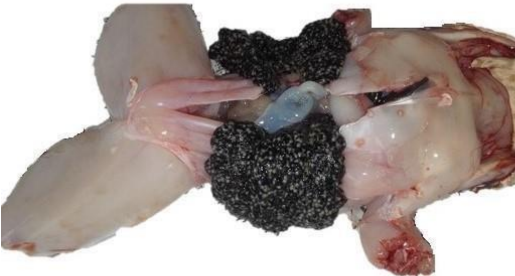
Ilustración 8. Rana Toro Ovada