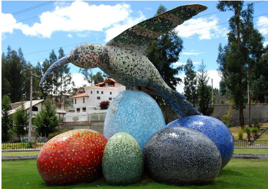
Imagen 4 “El colibrí”, Gonzalo Endara Crow, (1989), Quito, Ecuador

Para los referentes locales se sostuvo el objetivo de la representación de la especie aviar, como eje principal de la concepción de la obra. Porque se mantiene sujeto, al fin de realzar las piezas que comprendan la relevancia de la fauna ecuatoriana, como parte de un ciclo de la naturaleza. Cada especie, que se toma en cuenta es representante de diferentes territorios del Ecuador.