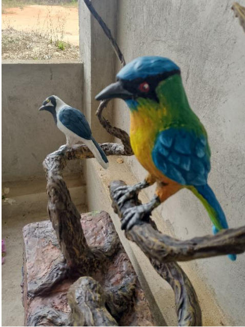
Imagen 21 Vista lateral derecha