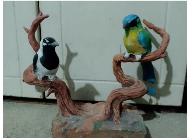
Imagen 11 Modelo aproximado