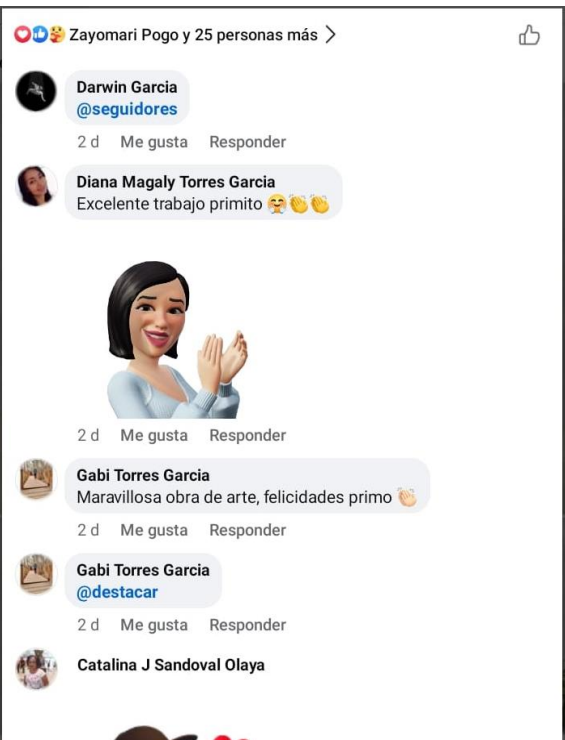
Imagen 25 Comentarios emitidos en la red social Facebook #1

"El arte es sin duda la manifestación de los seres humanos que expresan su sentimiento ante las cosas que lo rodea basadas en principios, en reglas o anti reglas, pero siempre es y será su forma de ver el entorno."