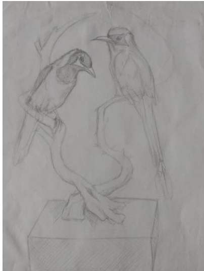
Imagen 10 Boceto seleccionado

Después de un riguroso análisis por parte de los autores y el tutor, la selección del boceto a realizar se prevé que ayudaría a la percepción de la tridimensionalidad de la pieza escultóricas y a su vez resaltar a las especies aviares. Posteriormente a la selección del boceto se empleó un modelo aproximado de lo que sería la escultura, para tener en cuenta las dimensiones de la pieza y el posicionamiento de los objetos y sus elementos.