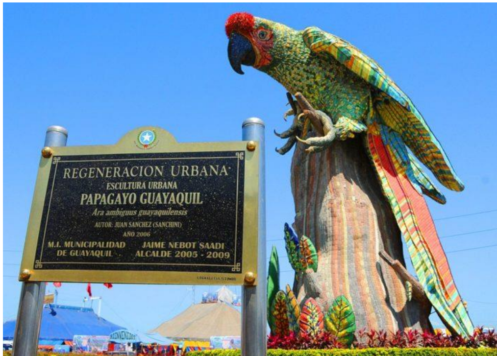
Imagen 5 “Monumento al Papagayo” Juan Marcelo Sánchez, (2006), Guayaquil, Ecuador.

La importancia de la iconografía dentro de un colectivo o comunidad, comprende la asimilación de un contexto por medios del lenguaje no verbal, como lo son los medios visuales. Por su fácil comprensión y asimilación de la misma realidad, lo cual permite a un colectivo comprender un concepto por medio de símbolos preestablecidos. En muchas culturas las imágenes de animales toman significados, por lo que representan para ellos, dentro de su territorio.