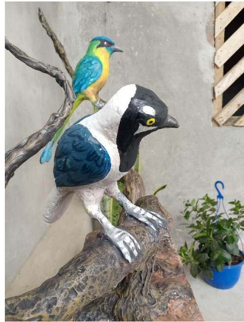
Imagen 22 Vista lateral izquierda