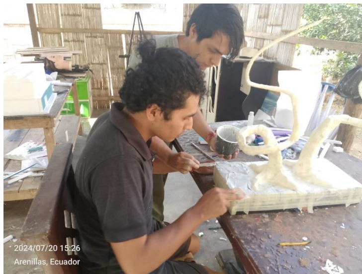
Imagen 15 Aplicación del gel de resina en la base de escultura.