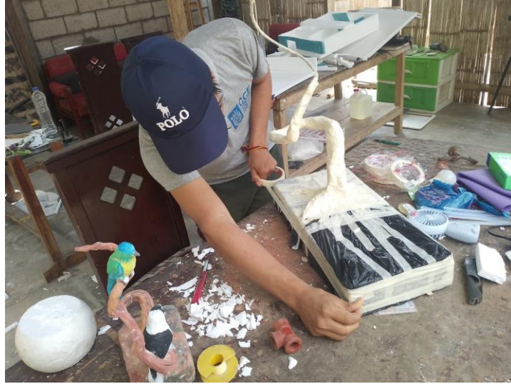
Imagen 12 Preparación de la base de la escultura