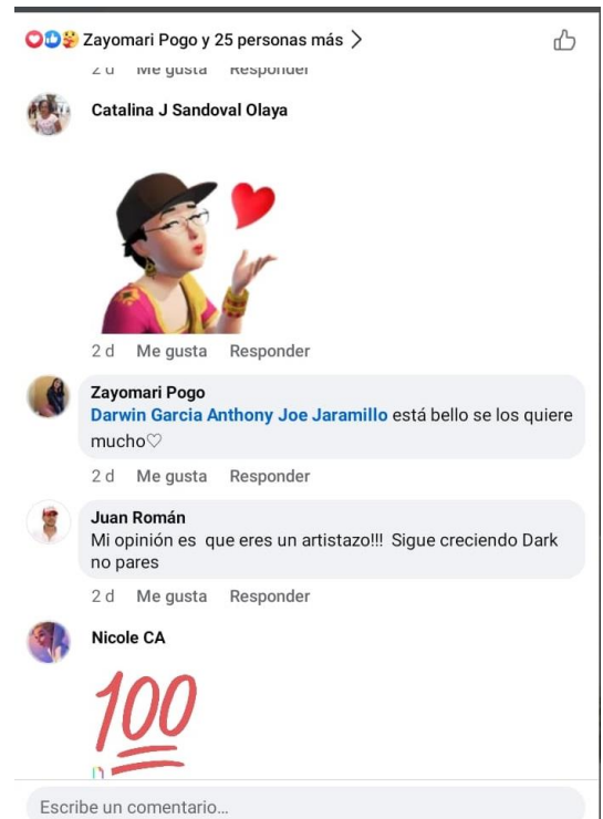
Imagen 23 Comentarios emitidos en la red social Facebook #2