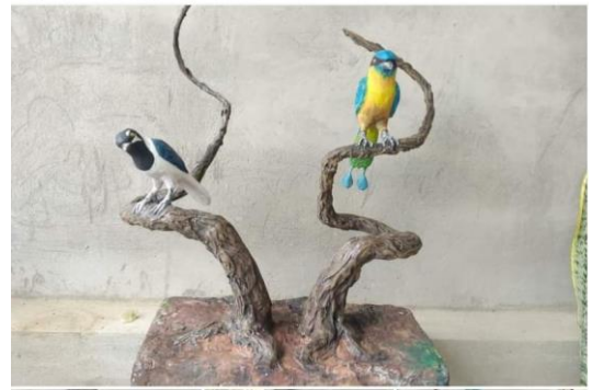
Imagen 24 Discurso Artístico en la red social Facebook.

espero saber sus opiniones con respecto a la obras