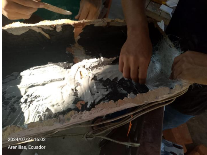
Imagen 17 Reforzamiento de la parte interna de la base de la escultura.