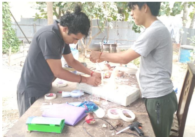
Imagen 13 Fijación de la estructura de las ramas con la base de la escultura.