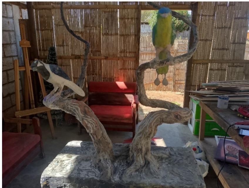
Imagen 19 Unión de los aves con la base de la escultura.