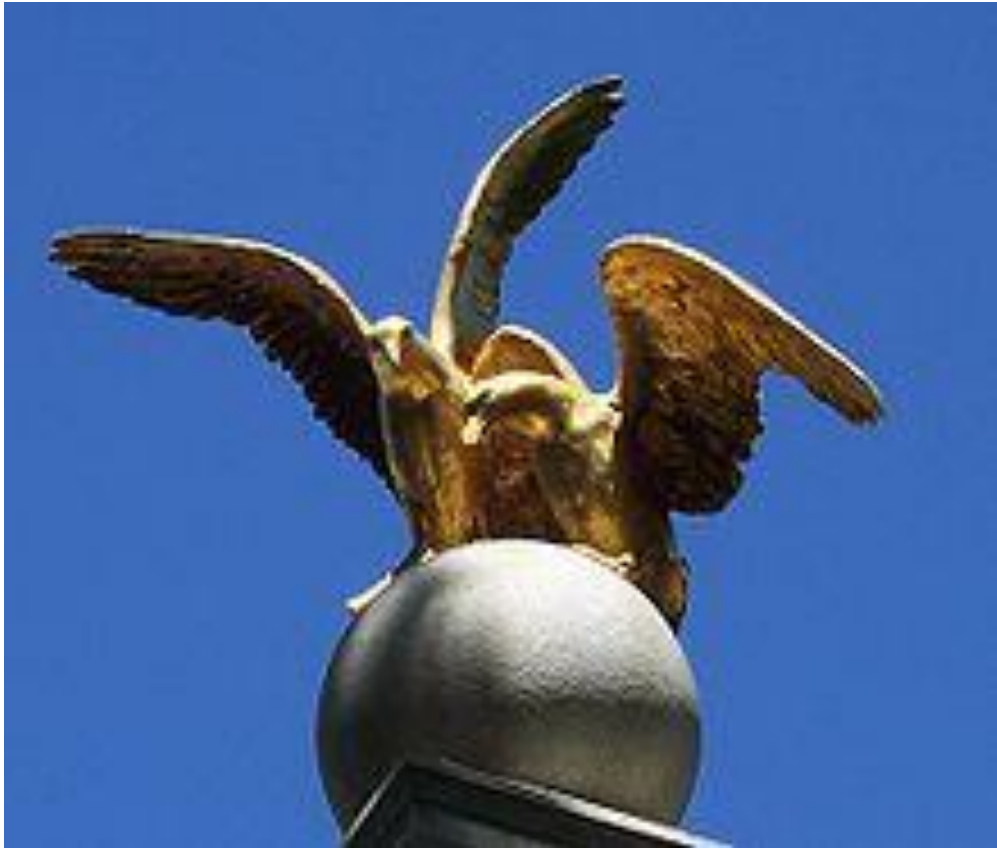
Imagen 2 “Monumento a las gaviotas”, Mahonri Young, 1913, Utah, Estados Unidos.

La formación de las esculturas de los diferentes artistas comprende dentro de un determinado territorio, como medio de resonancia del propio contexto, de su cultura y tradiciones. El símbolo que emplean las piezas, son manifestaciones físicas de las narrativas circundante de la comunidad, captando la conciencia colectiva llevándola al plano terrenal y reinterpretándolas. Para todo aquellos que no comprenden de la historia y cultura del territorio determinado.