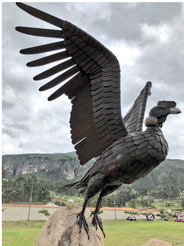
Imagen 6 "Cónдор Arturo", Miguel Cajamarca, (2018), Azuay, Ecuador.

A lo largo de la historia, la escultura ha servido como un poderoso medio para recordar y plasmar eventos significativos que han dejado una marca en un territorio o en la historia misma. La capacidad inherente de la escultura para perdurar a lo largo del tiempo la convierte en un medio ideal para representar estos sucesos trascendentales que quedan grabados en la memoria colectiva.