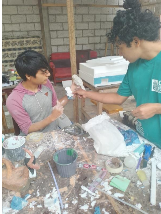
Imagen 18 Elaboración del modelo de la especie aviares.