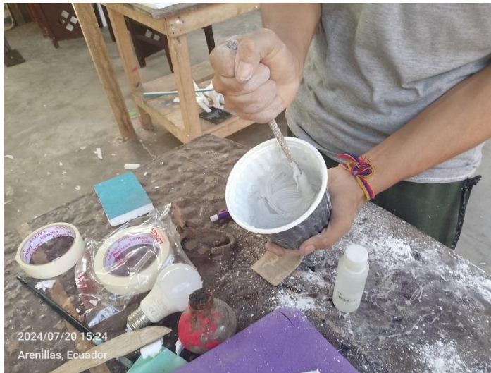
Imagen 14 Elaboración del gel de resina