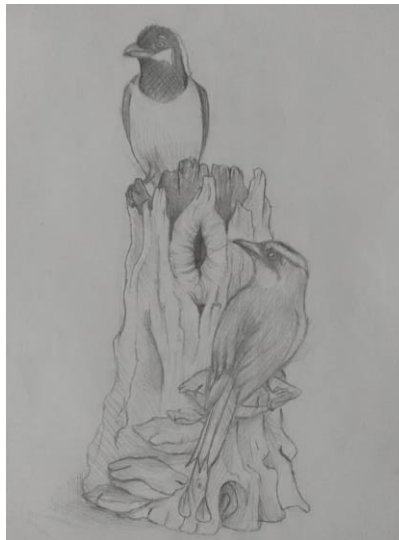
Imagen 8 Boceto 3