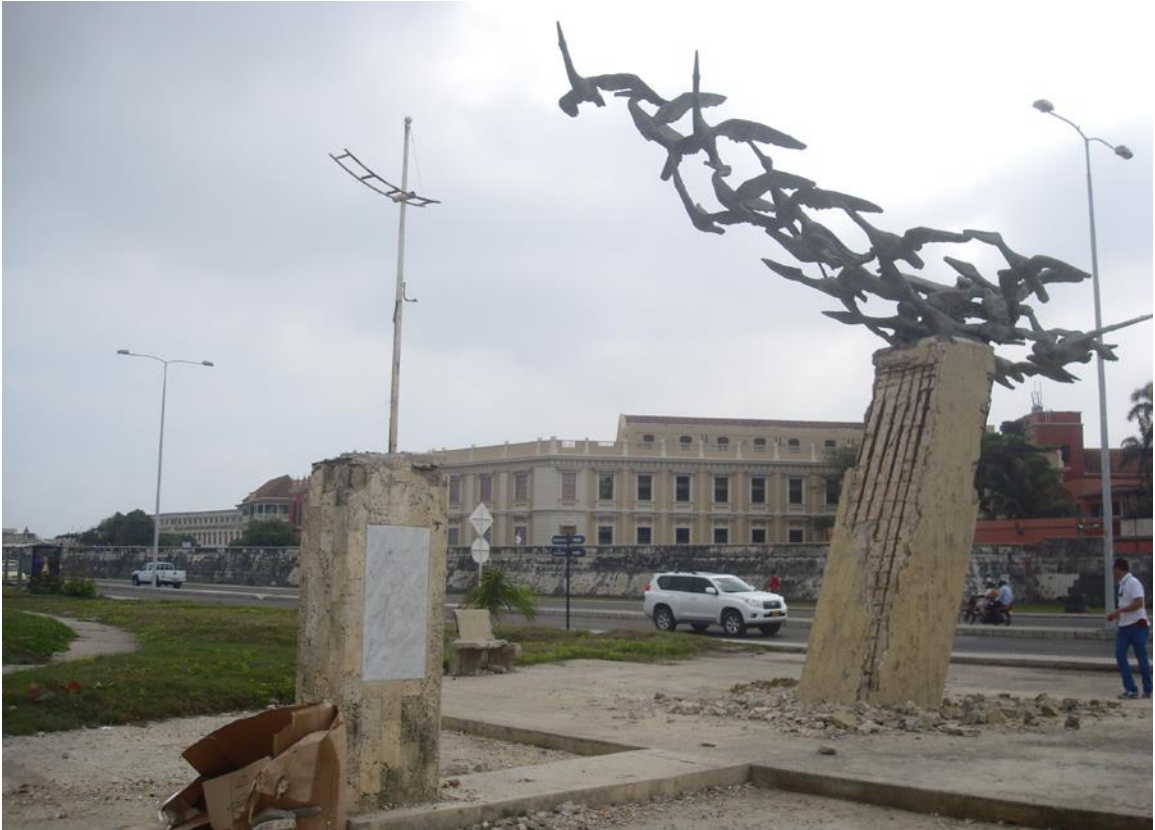
Imagen 1 “Alcatraces”, Eladio Gil, 1974, Colombia.

Dentro de los referentes para la formación y comprensión de las premisas para la conceptualización de la pieza escultórica, se comprendió una variedad de artistas los cuales mantuvieron una línea de concepción, que comprende la formación de monumentos y estructuración de piezas que abarquen la fauna como comprensión de su resultado final.