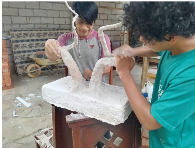
Imagen 16 Polución de la base de la escultura.