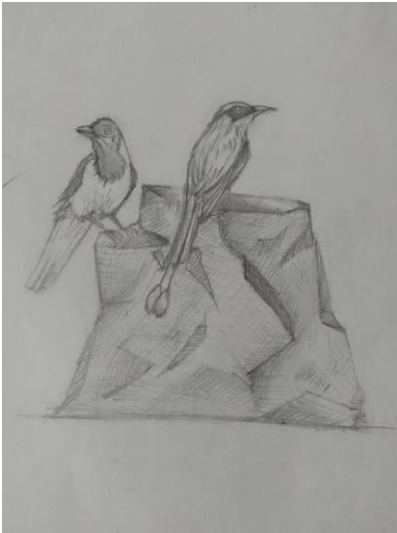
Imagen 9 Boceto 1

Dentro de este Capítulo encontraremos el desarrollo y el procedimiento de la obra, a su vez podremos encontrar los pasos de la elaboración de la pieza y sus inconvenientes surgidos en el proceso de creación. Para la preproducción de la obra se elaboró tres diferentes bosquejos respectivos a la temática de arte e identidad cultural de Arenillas, de los cuales se selecciono uno para el enfoque de la producción y emitir un boceto que contenga lo preestablecido en los objetivos. Y poder captar todo el interés en el desarrollo del boceto y poder pasar a la estructuración de las bases esculturas, con el fin de determinar los materiales y herramientas a considerar en su elaboración.