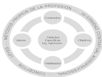
Figura 3. Componentes que integran las didácticas específicas para la formación

En este sentido, como muestra la figura No. 2, se hace necesario acudir a la didáctica específica de la profesión la cual explicita los contenidos, objetivos, habilidades, valores, sistematizadas desde los conceptos, leyes, diversidad contextual agro-profesional y dinamizadas por los métodos propios de la profesión, que en su relación armónica con los provenientes de la didáctica general garantizan un aprendizaje significativo.