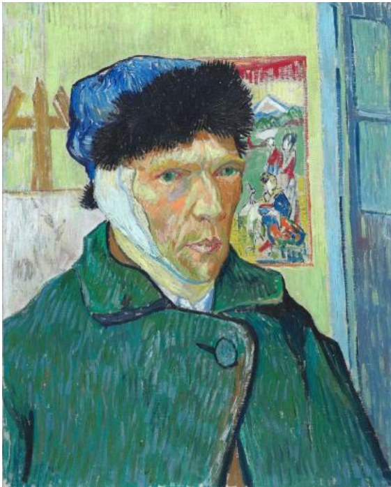
Imagen 1. Vincent Van Gogh “Autorretrato con la oreja cortada” (1889).

Además, el arte se emplea de manera espiritual, ayudando a fortalecer tanto cuerpo y mente. La Organización Mundial de la Salud (OMS) respalda muy seriamente las prácticas artísticas como un medio eficaz para la salud física y emocional, tanto en clínicas como en otros espacios como escuelas y universidades. También, se encuentra en los canales educativos proporcionados por los Ministerios de Salud, donde a través de gráficas, animaciones y carteles, el arte se usa para promover mensajes claros y precisos sobre la prevención de enfermedades y la detección de problemas emocionales.