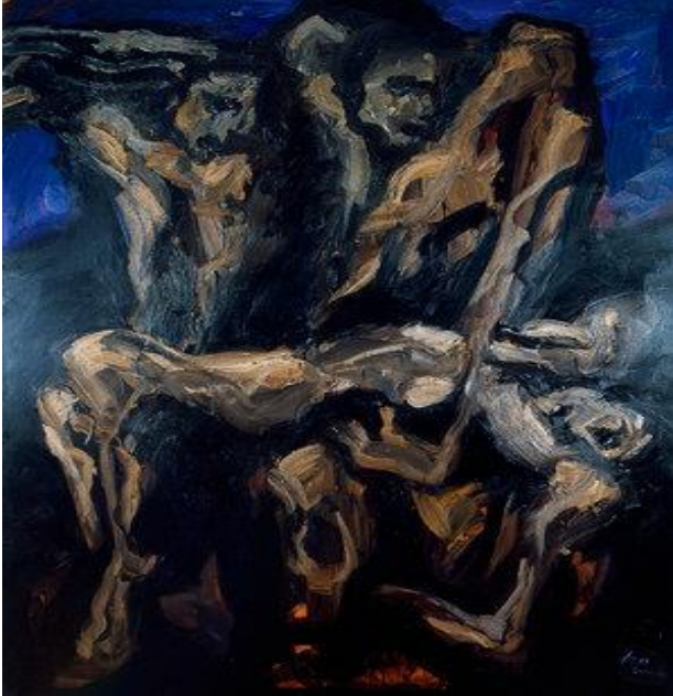
Imagen 4 Oswaldo Viteri "Piedad" (2004).

con y para el arte. Esta obra de nombre "Piedad" de estilo surrealista creada por él busca reflejar la búsqueda espiritual y la conexión con lo divino del ser humano a través de pinceladas que captan una atmósfera tranquila y relajante. Como lo indica el siguiente autor: