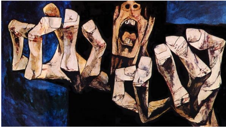
Imagen 3 Oswaldo Guayasamín “Edad de Ira” (1970).