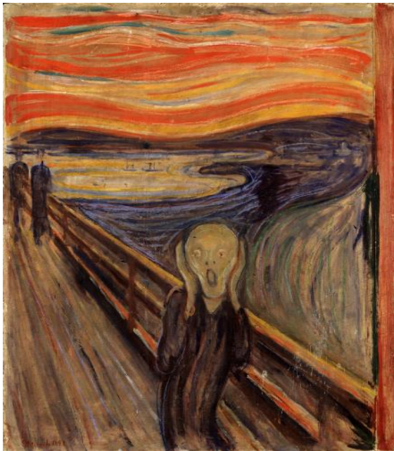
Imagen 2: Edvard Munch “El grito” (1893).

Dando por hecho que a través de las obras que hace un artista nos permite saber qué tipo de pensamiento está utilizando para darnos una idea de cómo es la percepción de su mundo.