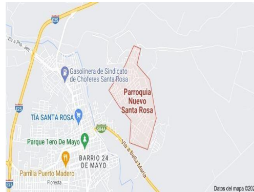
Gráfico 1. Ubicación de cantón Santa Rosa