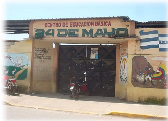
Ilustración 2: Fotografía de la institución