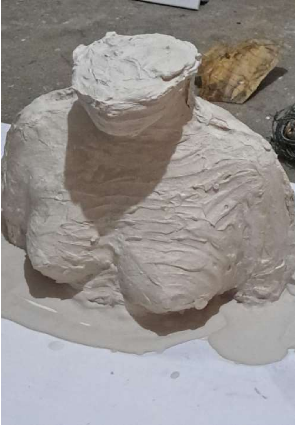
Imagen 11: Relleno de la moldura