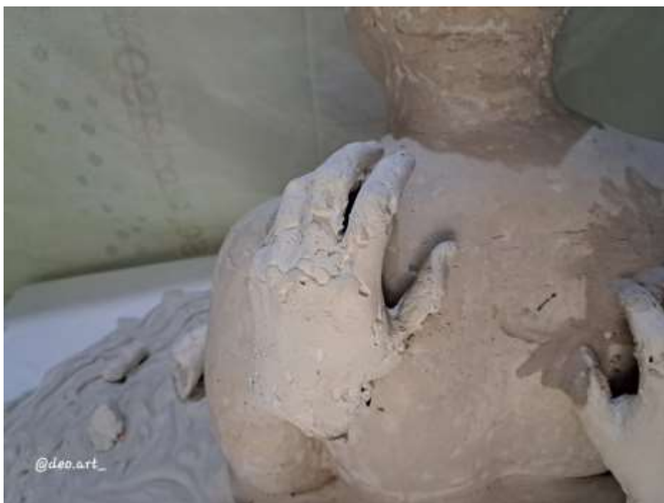
Imagen 19: Obra final