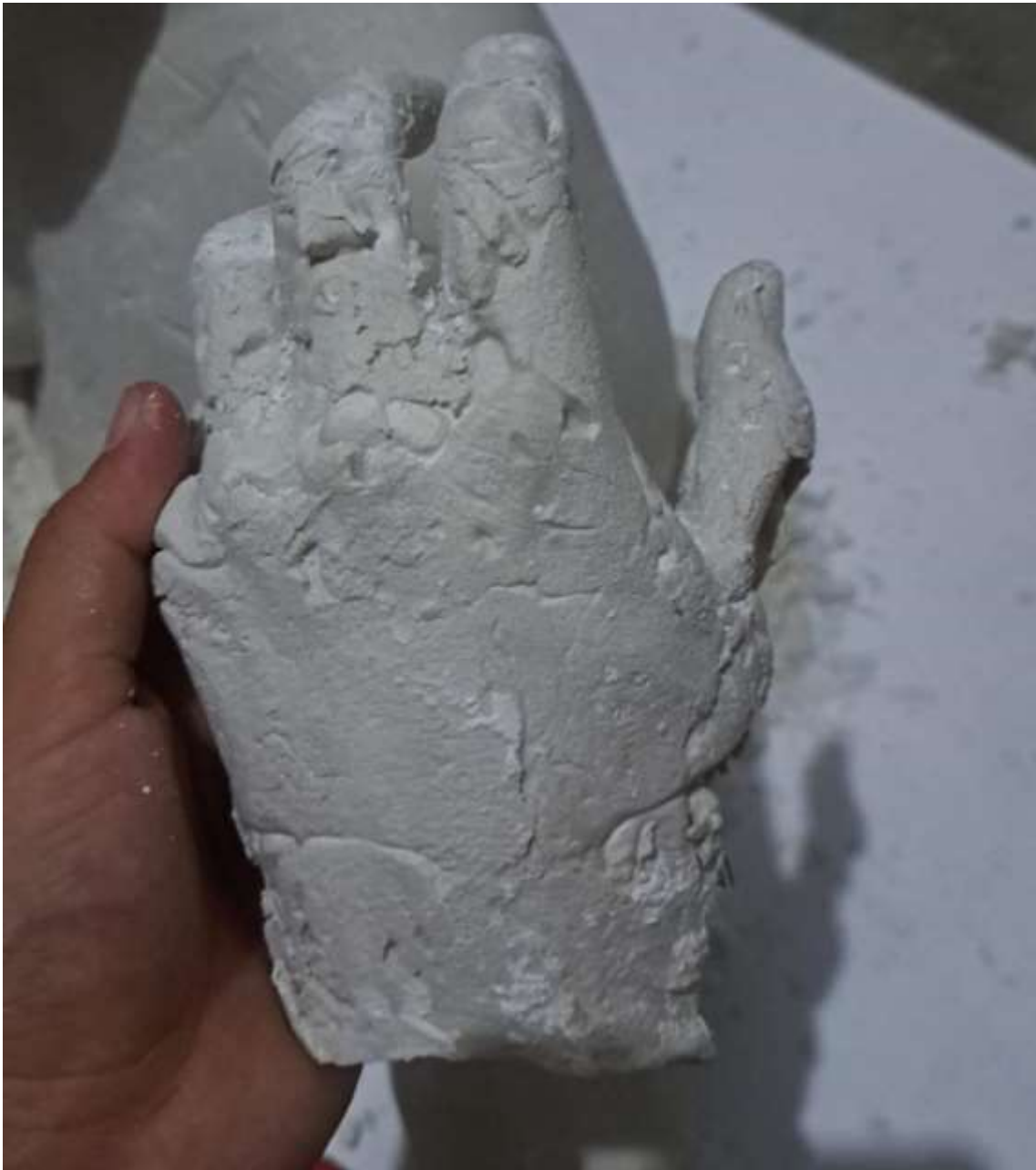
Imagen 14: Mano izquierda