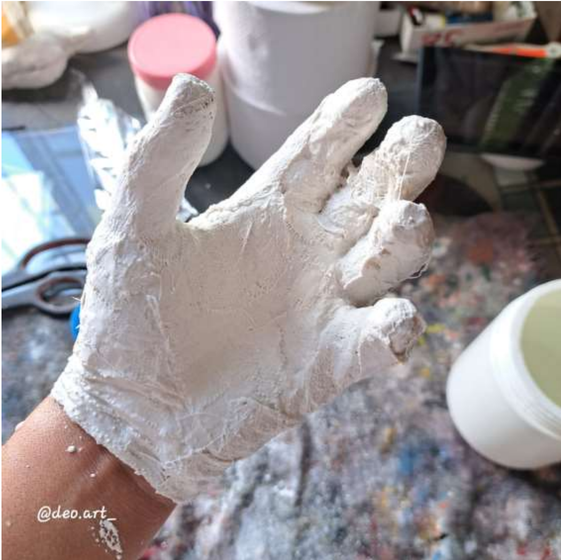
Imagen 9: Molduras de manos