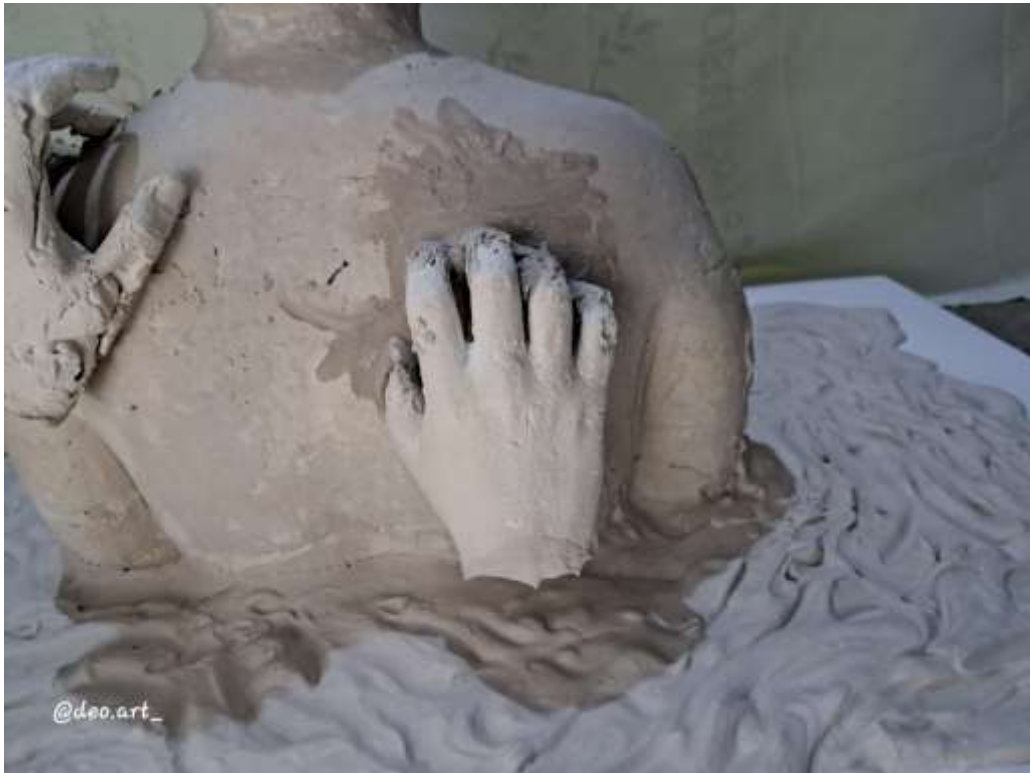
Imagen 18: Obra final