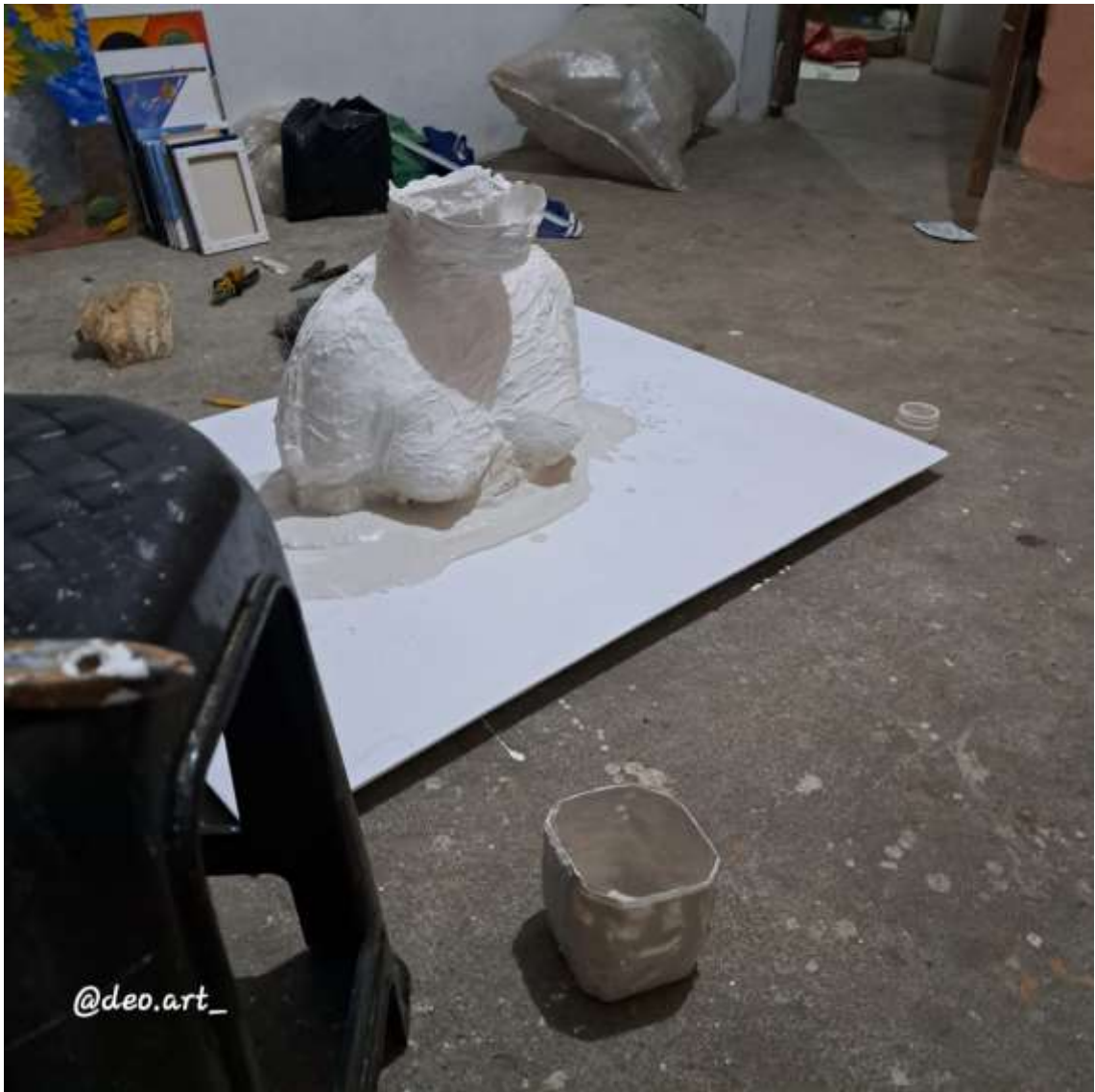
Imagen 8: Moldura de yeso