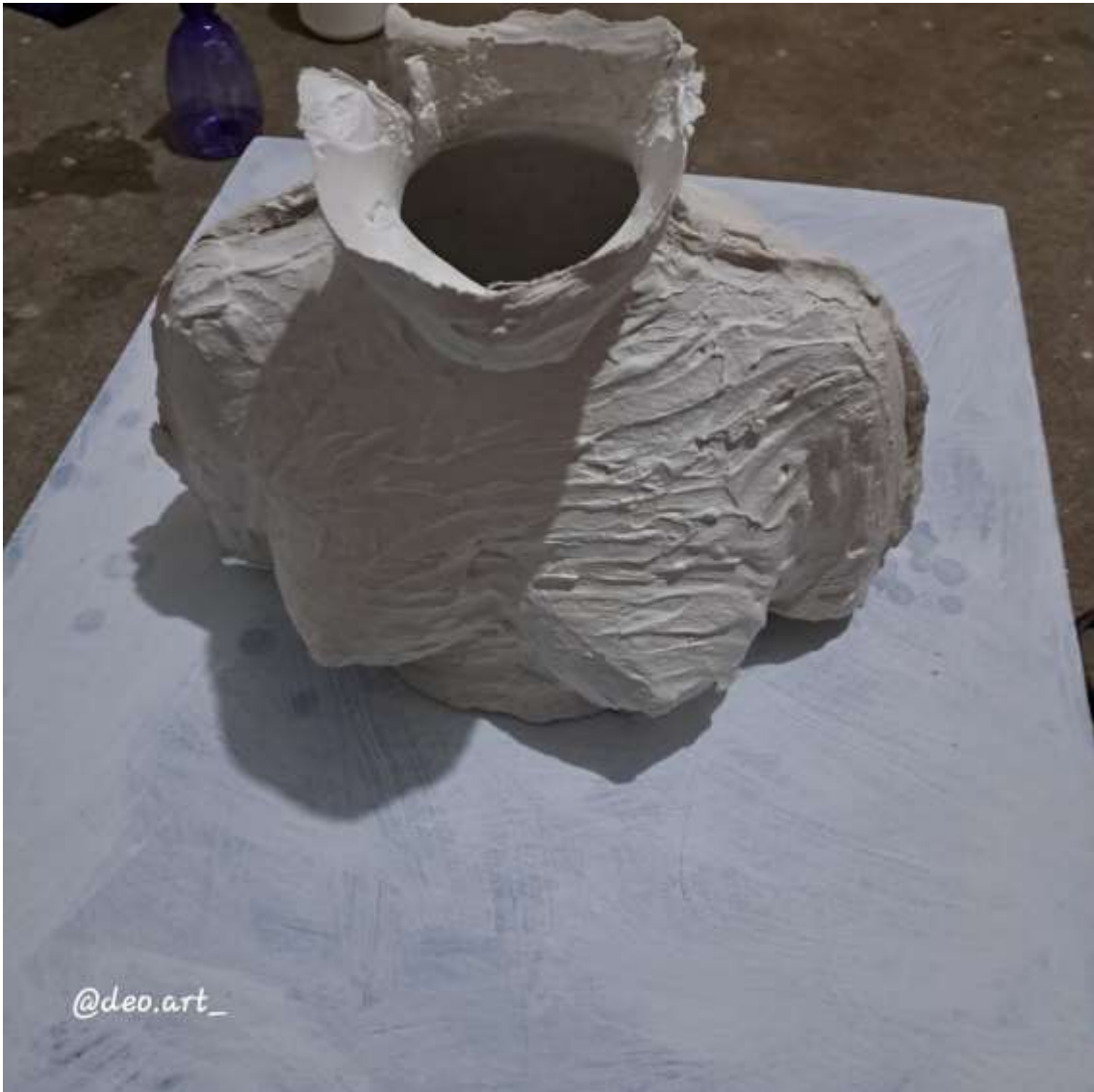
Imagen 7: Moldura de yeso