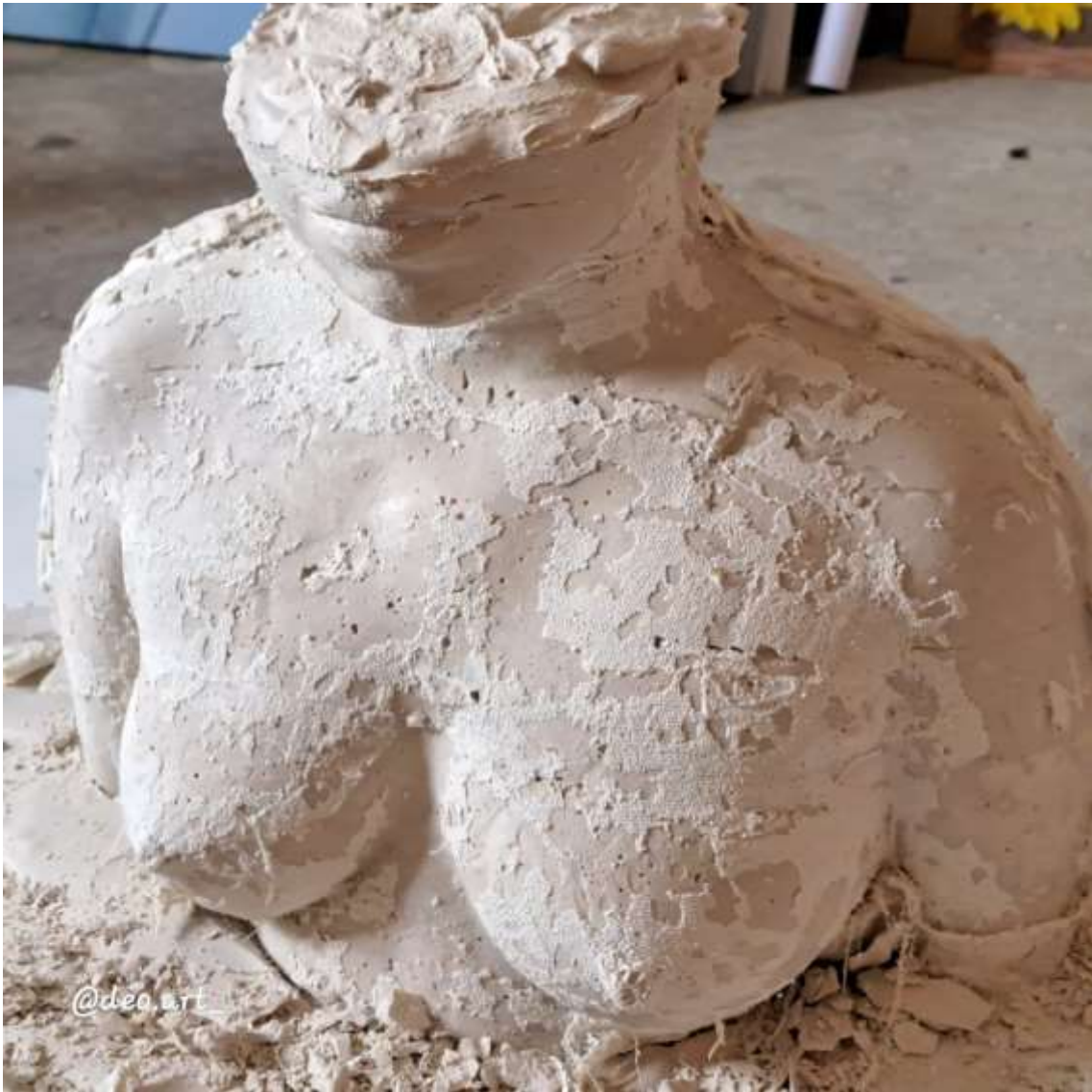
Imagen 12: Retirada de las vendas a la moldura