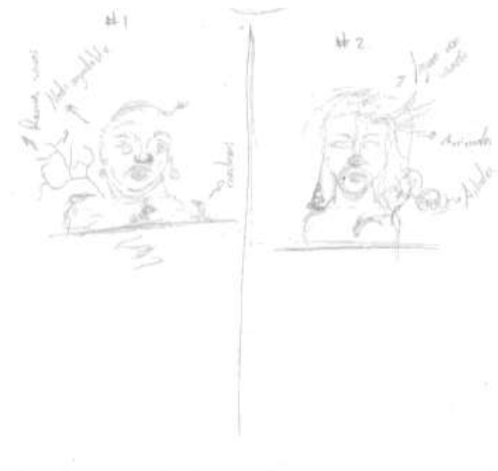
Imagen 3: Boceto tres

Nos describe que la estética es un termino que muchos piensan que es definitivo cuando no lo es, de este modo las personas piensan de una manera equivocada respecto al este término, ya que podemos identificar a la estética como la experiencia individual del mundo.