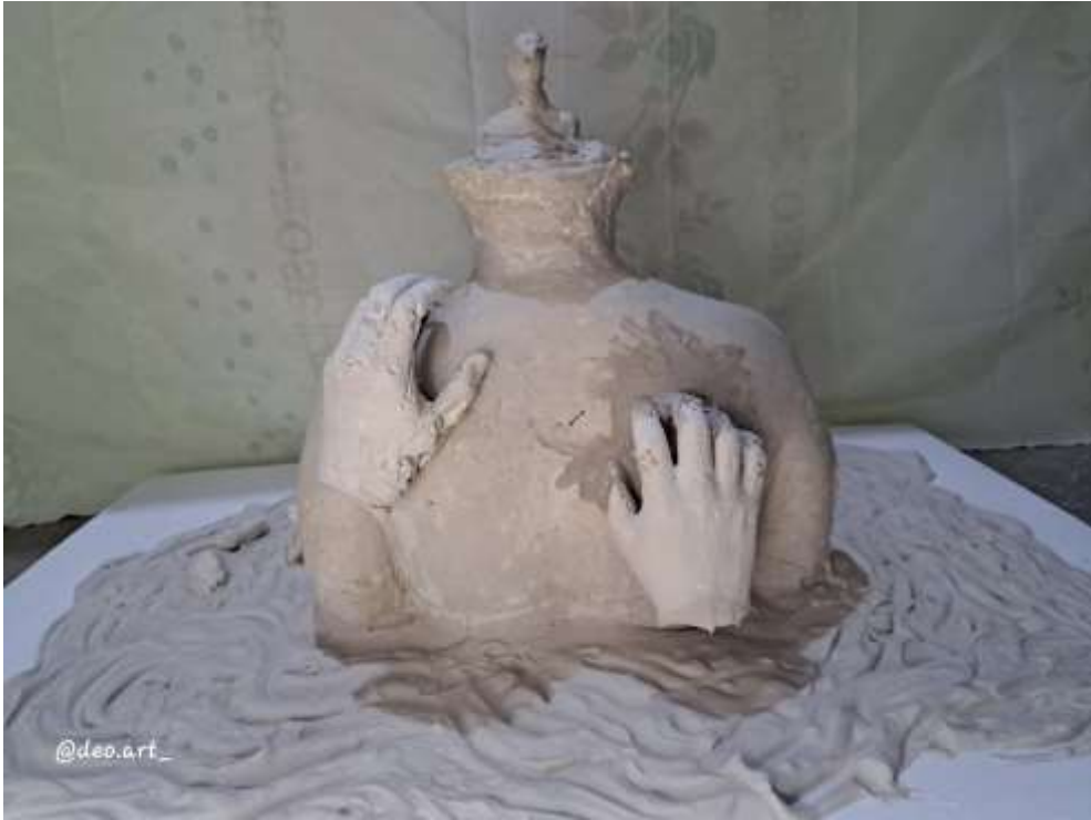
Imagen 17: Obra final