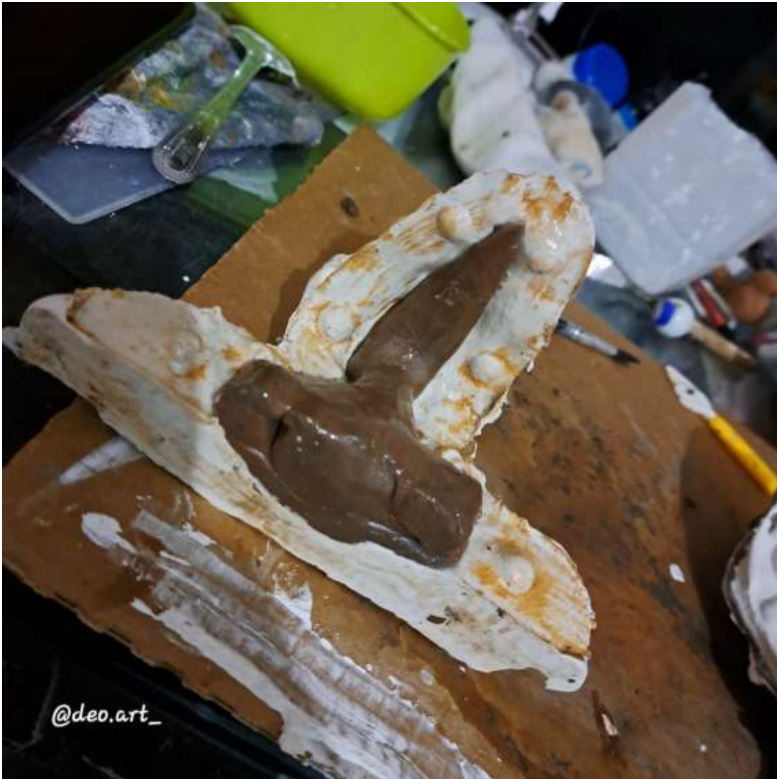
Imagen 16: Molde