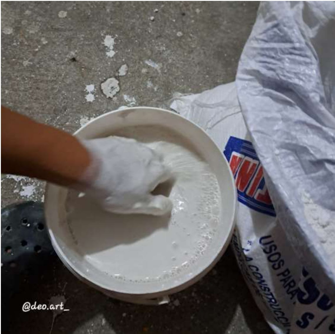
Imagen 10: Preparación del yeso