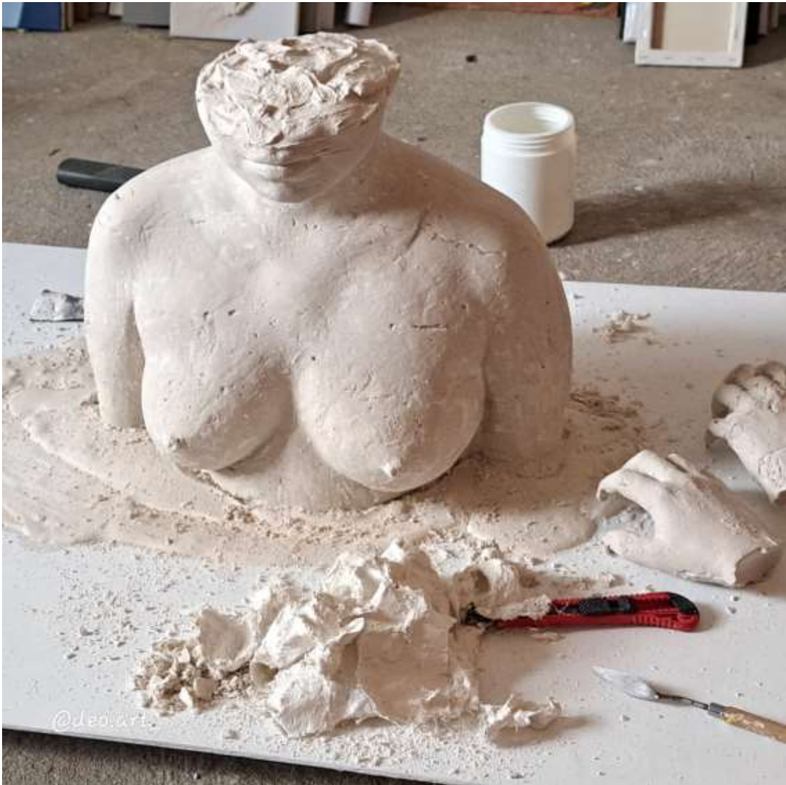
Imagen 15: Parte de obra