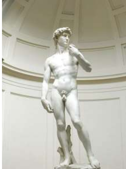
Ilustración 1 El David de Miguel Ángel (1501-1504)

Fuente 1: https://es.m.wikipedia.org/wiki/Historia_de_la_escultura