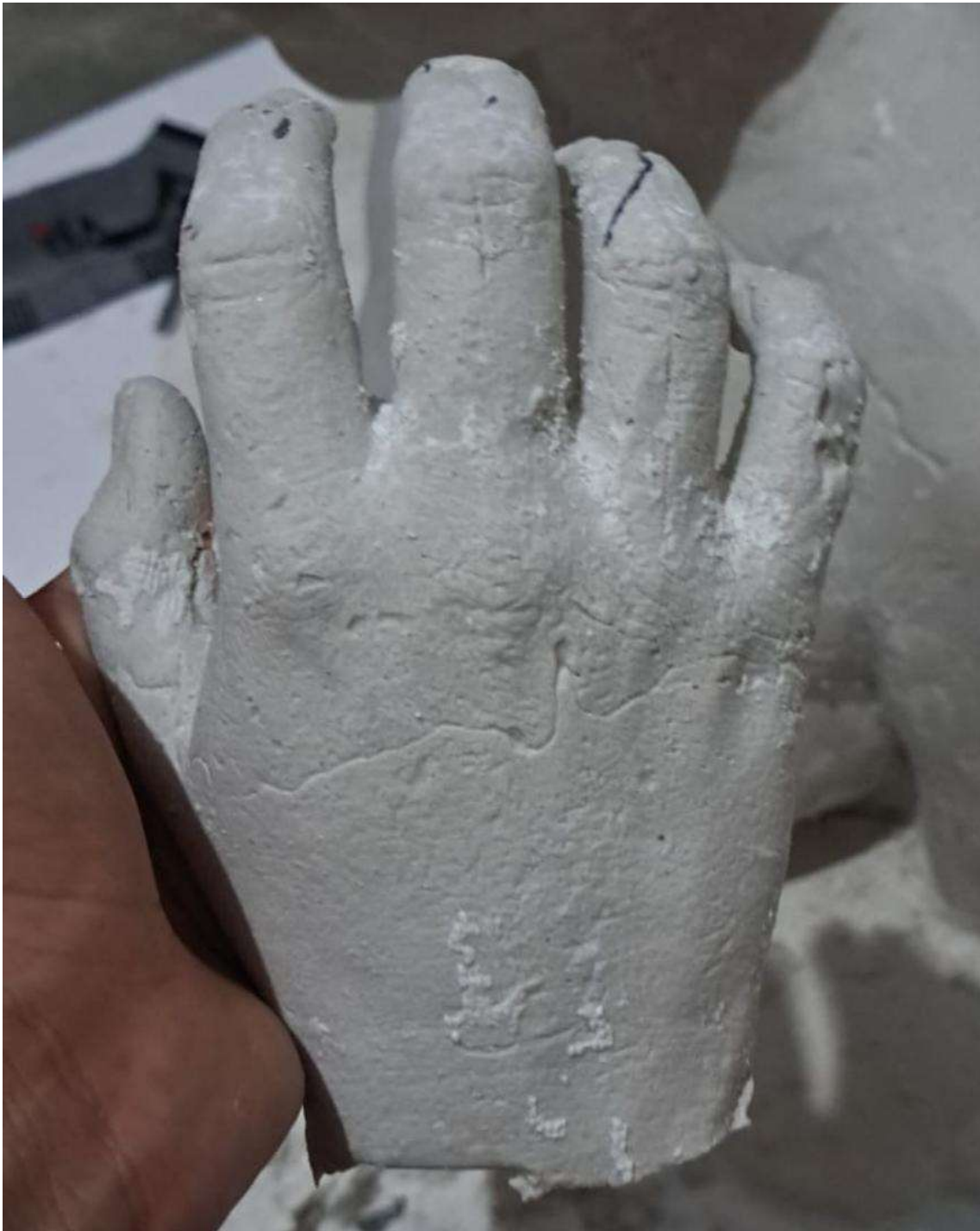
Imagen 13: Mano derecha