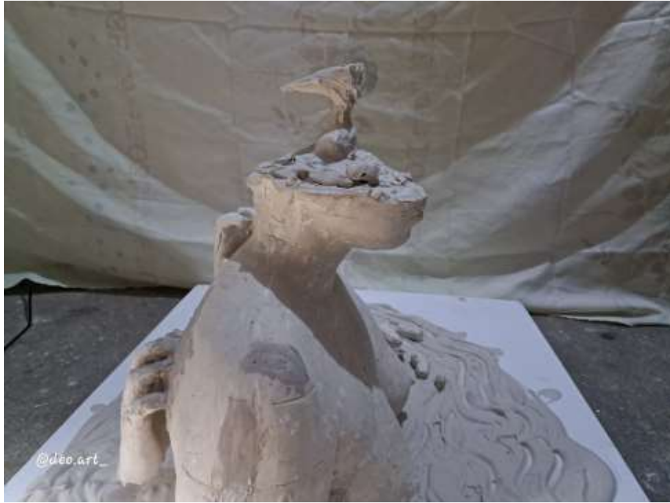
Imagen 23: Obra final