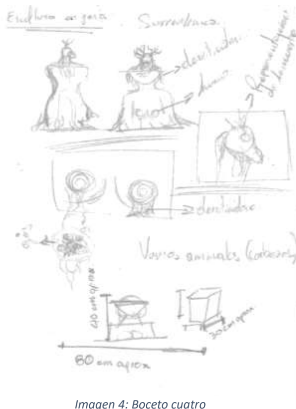
Imagen 4: Boceto cuatro

Puesto esto, la obra no solo tiene que quedar en lo tangible, sino, que también tiene que mostrar algo a través de la conciencia y la idea de cada individuo, por ende, el boceto 3 no cumple con mi idea para la representación adecuada ya que muestra por separado la belleza y la fealdad, no me decía nada respecto a las vivencias, es decir, no se lograba relacionar la estética como experiencia sensorial y cognitiva.