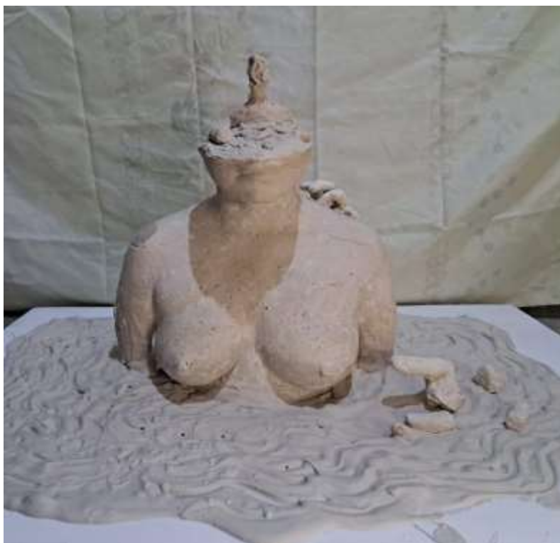
Imagen 20: Obra final