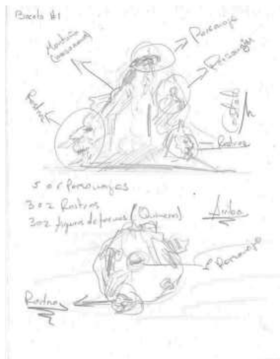
Imagen 1 Boceto uno

En base a esta cita, el trabajo se desarrolla mediante el surrealismo y la creatividad. De este modo se presentan los siguientes bocetos.