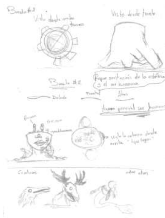
Imagen 2: Boceto dos

De este modo se busca que la obra exprese de manera puntual la intención y saber que la estética queda grabada en nuestro ser.