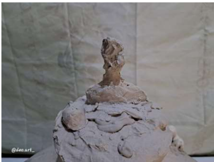
Imagen 22: Obra final