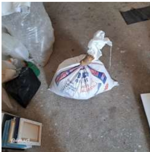
Imagen 5: Compra de yeso

De acuerdo a estos materiales se comenzó hacer la obra.