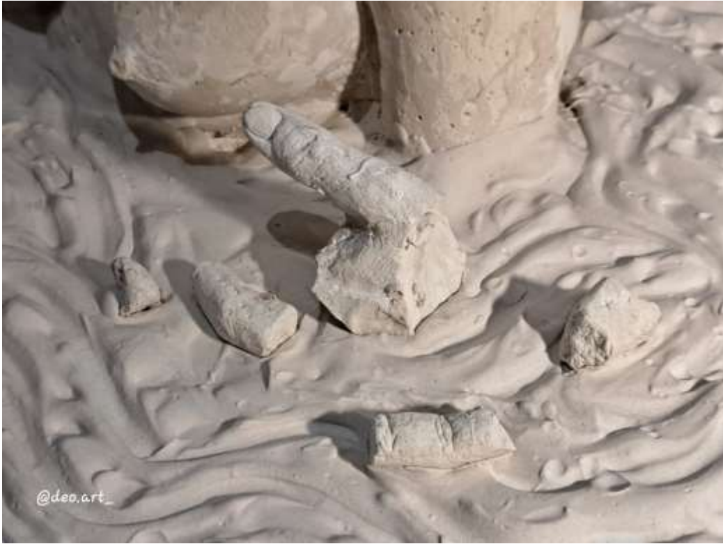
Imagen 24: Obra final