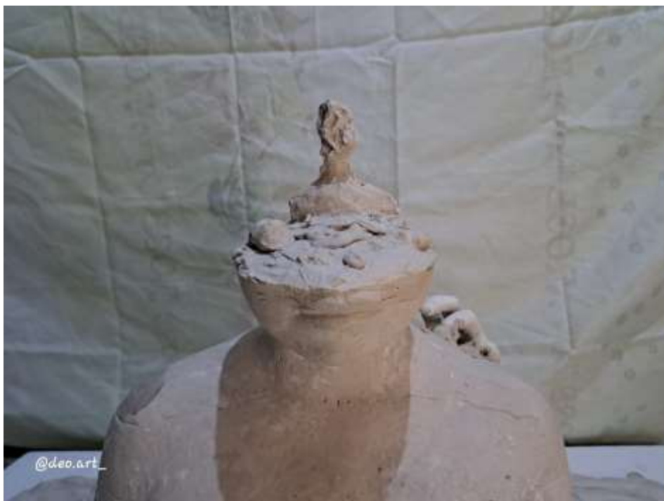
Imagen 21: Obra final