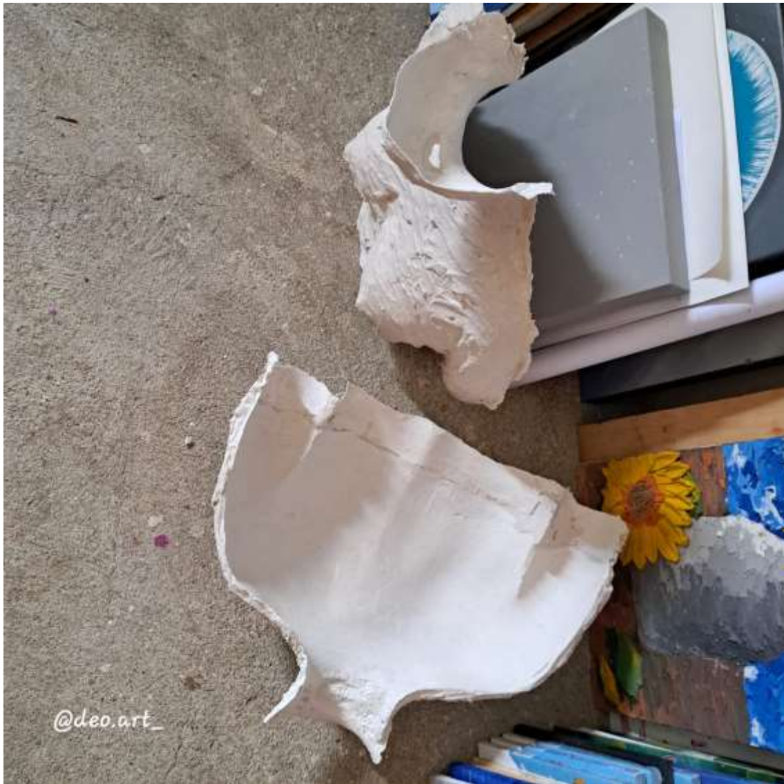
Imagen 6: Moldura de torso