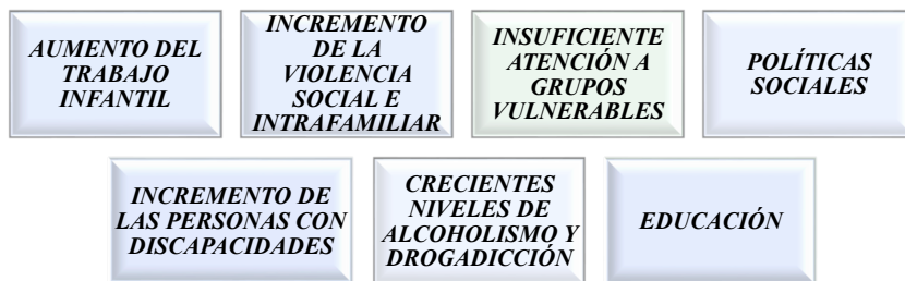
Figura No. 1 Problemas detectados en el estudio de pertinencia de la carrera

La malla curricular aprobada en el 2016, contaba con 9 Períodos Académicos Ordinarios (PAO) organizados en asignaturas ubicadas en las Unidades de Organización Curricular: Básica, Profesional y de Titulación; correspondientes a los campos de formación: