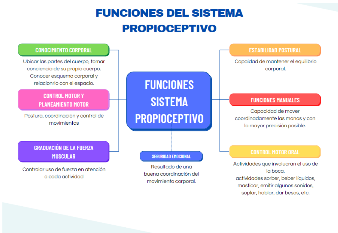
Figura 4. Funciones del sistema propioceptivo.

Elaborado por: Ma. Del Cisne Román. Fuente: (Quispe y Aronés, 2014).