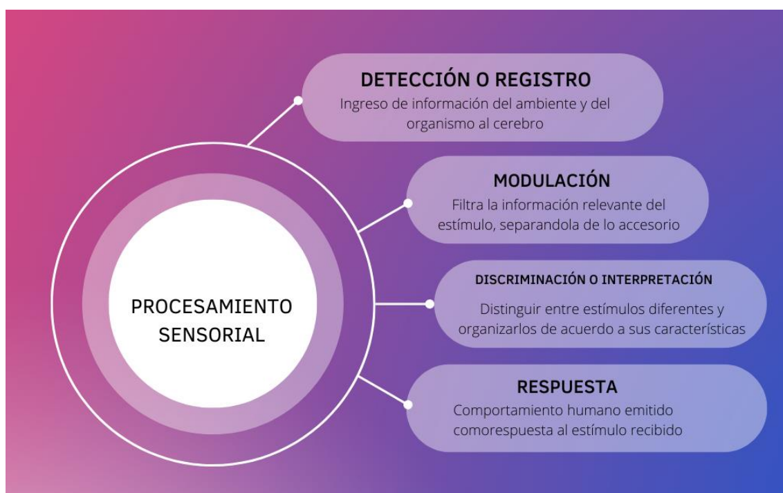
Figura 3. Procesamiento sensorial

Elaborado por: Ma. Del Cisne Román. Fuente: (Quispe y Aronés, 2014).