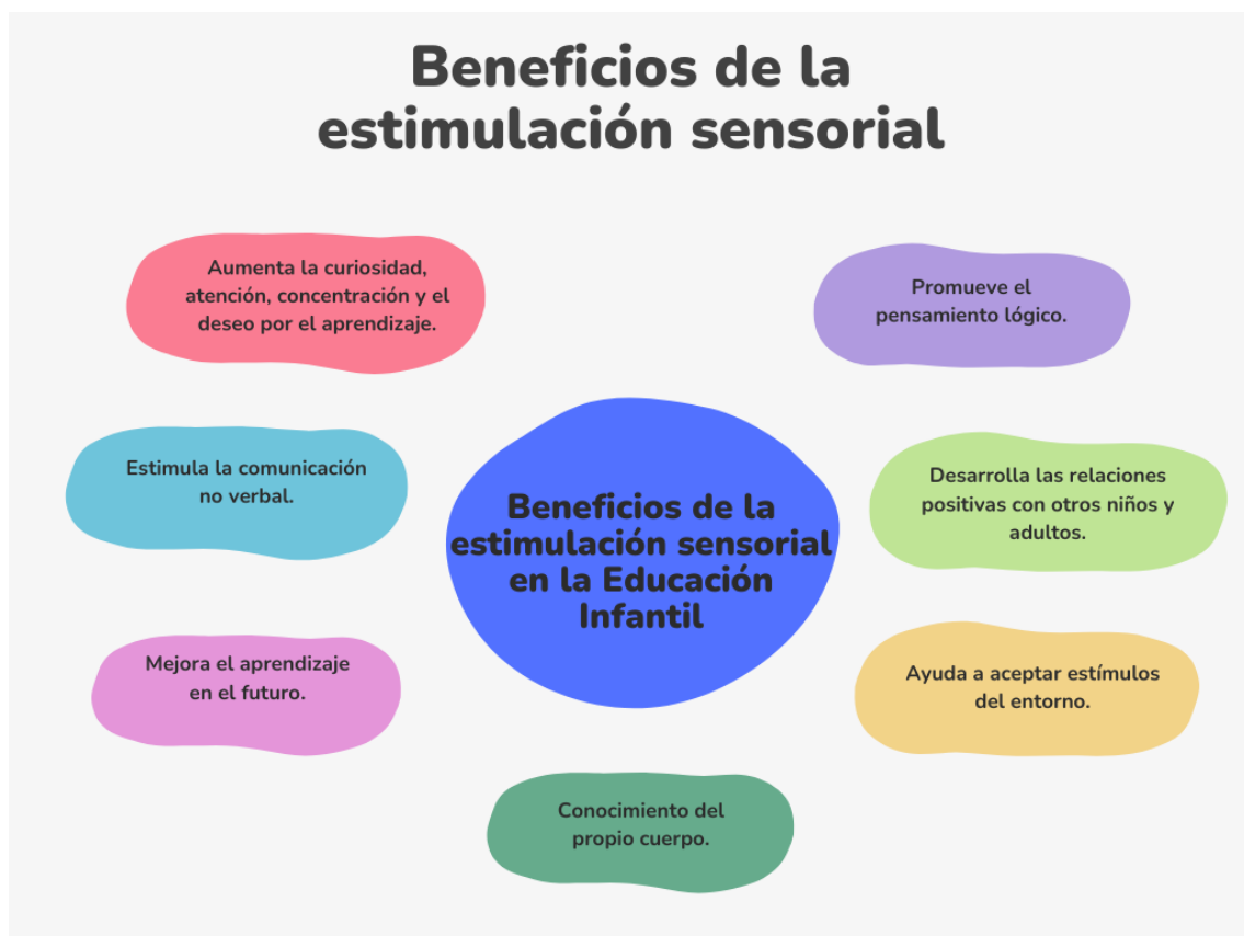
Figura 2. Beneficios de la estimulación sensorial.

Elaborado por: Ma. Del Cisne Román.