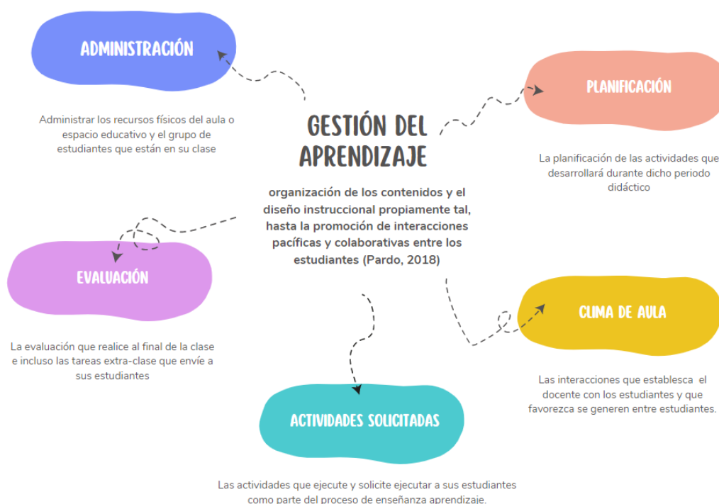
Figura 1. Gestión del aprendizaje.

Elaborado por: Ma. Del Cisne Román.