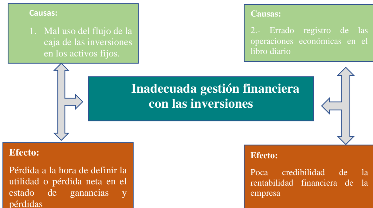
Ilustración 1. Árbol del problema