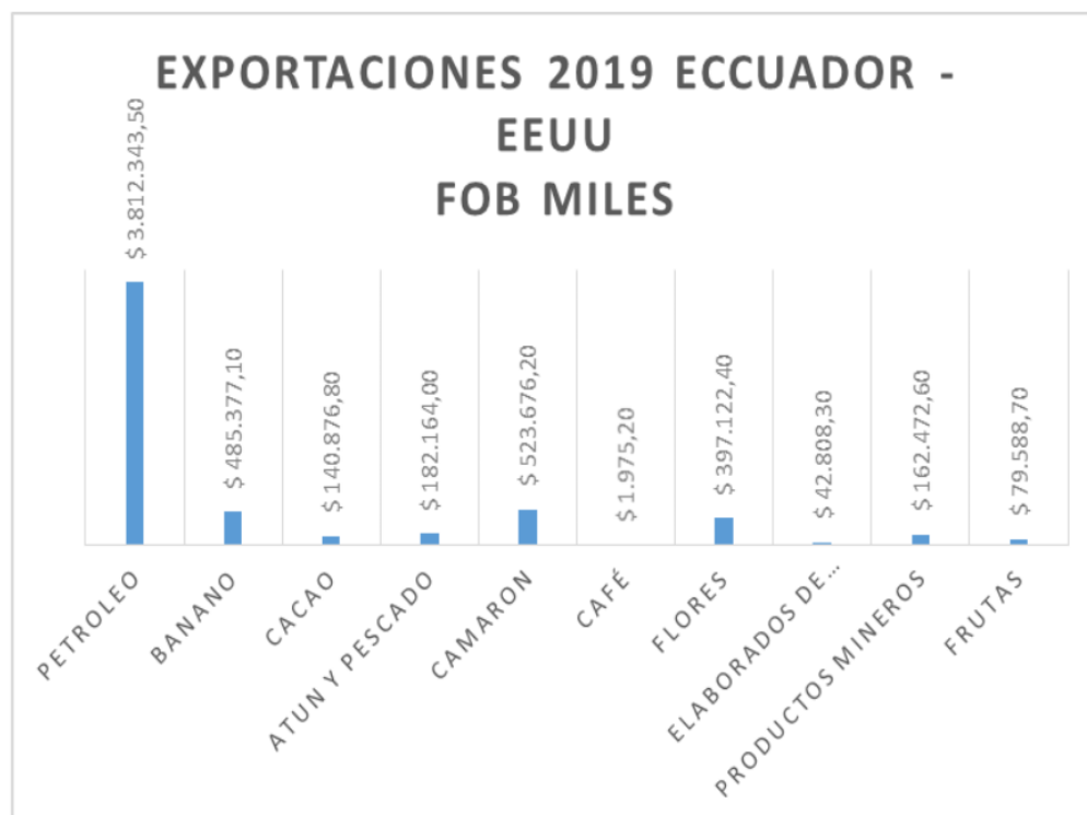
Ilustración 2: Exportaciones Ecuador – Estados Unidos año 2019.