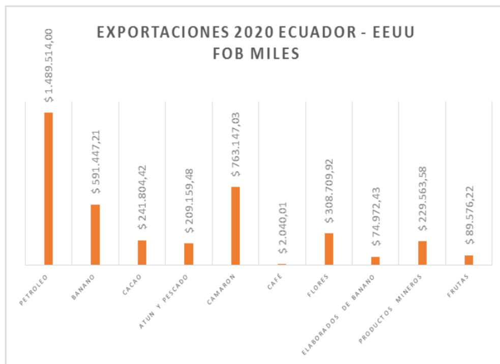
Ilustración 3: Exportaciones Ecuador - Estados Unidos año 2020