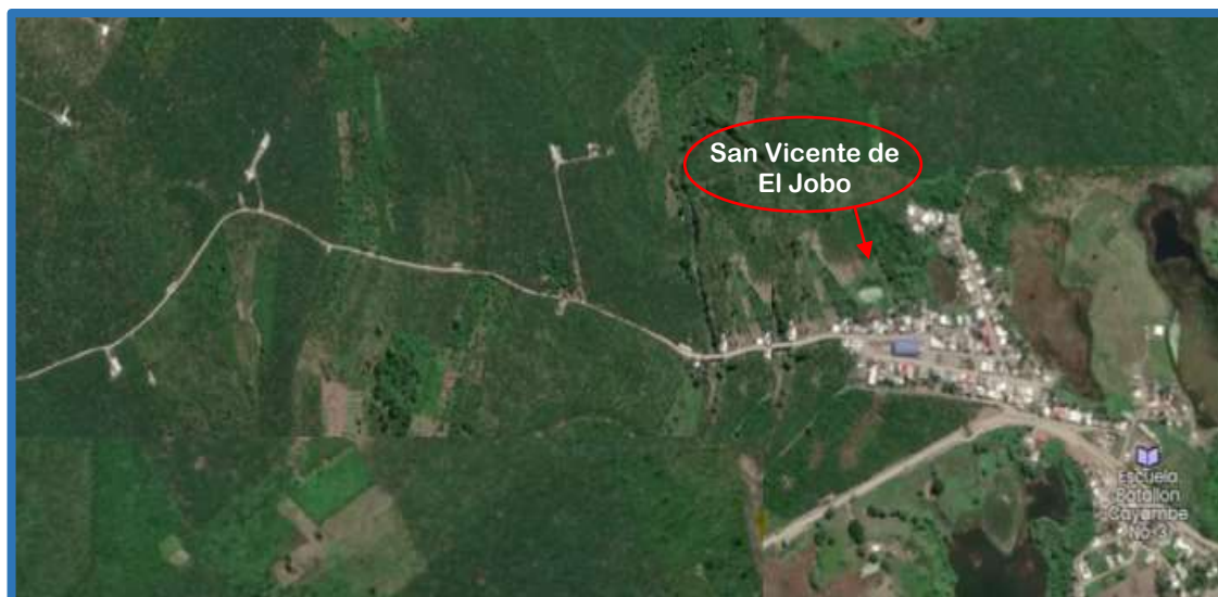
Mapa 1. San Vicente de El Jobo

1.6.2.3 Análisis del contexto. El cantón Arenillas perteneciente a la provincia de El Oro, cuenta con 33.000 habitantes, cuyos límites se encuentra al norte con: Santa Rosa y Huaquillas, al sur con Las Lajas y Marcabellí, al este con Santa Rosa y Piñas, al oeste con Perú. Los inicios de este territorio estaban predominados por pobladores de áreas rurales y en la actualidad su población es urbana.