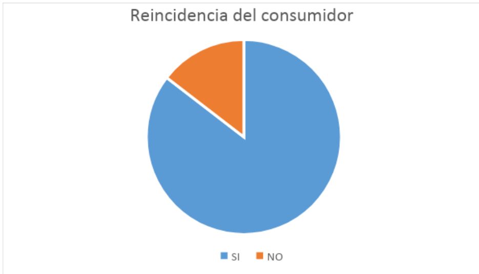
Gráfico 4. Reincidencia del consumidor