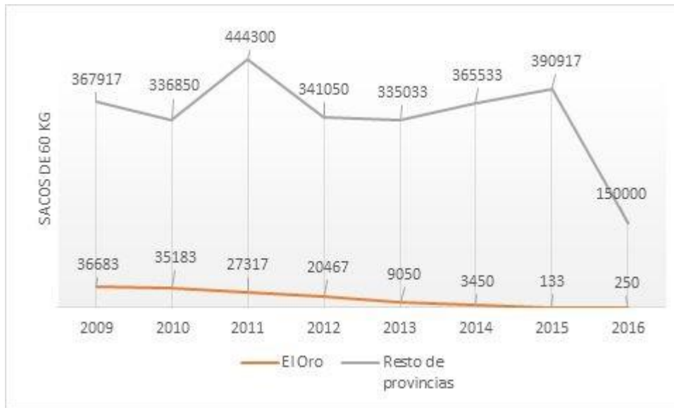
Figura3. Producción de café en la provincia de El Oro en el periodo 2009-2016.