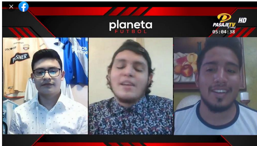
Programa Planeta Futbol

El grupo de panelistas del programa Planeta Fútbol que se transmiten por Pasaje TV, puso en práctica cada una de las técnicas aprendidas durante el Webinar ya que se ve mejoría respecto a la parte de locución, análisis y respiración diafragmática. De esta forma se identifica también el compromiso que tienen por brindar lo mejor a sus espectadores. Y actualmente buscan renovar sus espacios con más panelistas y una línea gráfica diferente, además de reuniones previas donde preparen el programa y contenido que van a analizar en vivo.