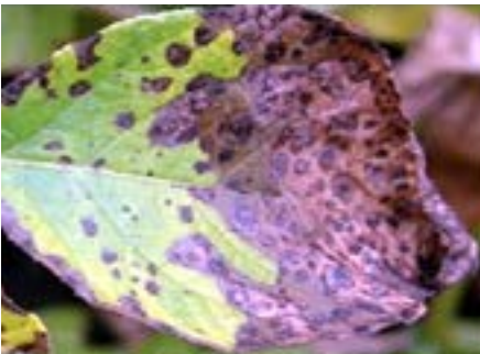
Figura 4. Imagen con contraste aumentado

En la Figura 4 se puede observar cómo mediante las diferentes técnicas utilizadas en la imagen adquirida dan realce a las características de la misma, teniendo como resultado una imagen con un contraste mejorado.