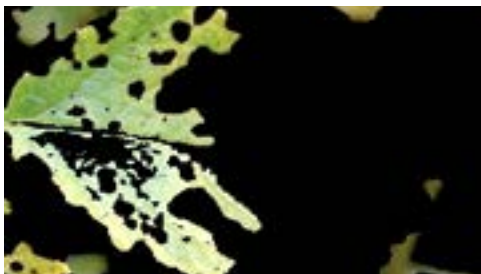
Figura 5. Imagen segmentada con algoritmo de detección de límites y puntos

Segmentación con algoritmo de detección de límites y puntos.