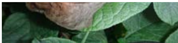
Figura 2. Tizón tardío en la hoja de la papa.

Virosis: Virus que causa enanismo, amarillamiento, deformación de las hojas y necrosis tanto en las hojas como en el tubérculo (Pérez y Forbes, 2011, p.11). Además, Acuña y Sandoval (2017) señalan: “Su importancia radica en