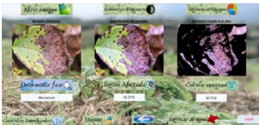
Figura 9. Resultado de la comparación de la imagen ingresada