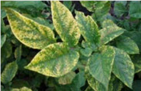
Figura 3. Virosis en la hoja de la papa

que genera pérdidas importantes en el rendimiento y calidad del cultivo, además de un aumento en el rechazo de semilleros para certificación” (p.1).