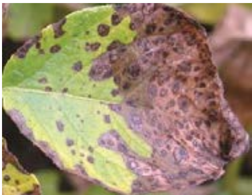
Figura 1. Alternaria en la hoja de la papa

Tizón Tardío: Martínez, Barrios, y Santos (2007) afirma: “El ciclo de este hongo es bastante complejo, con la formación de varios tipos de esporas, el desarrollo de la enfermedad está favorecido por la humedad. Es la plaga más peligrosa y destructiva ya que, al presentarse condiciones favorables para su desarrollo, puede en pocas horas causar la defoliación y muerte de las plantas” (pp.219-221).