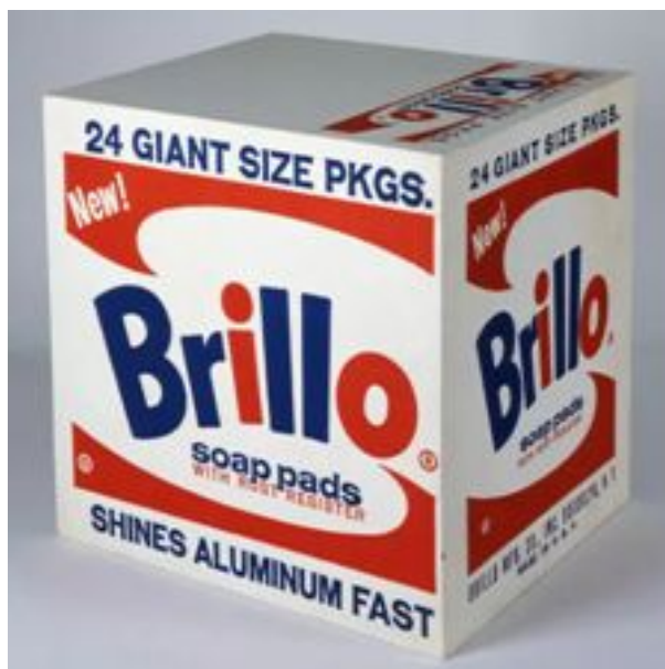
Imagen 2, "Brillo Soap Pads Box" 1964. Andy Warhol. Escultura.