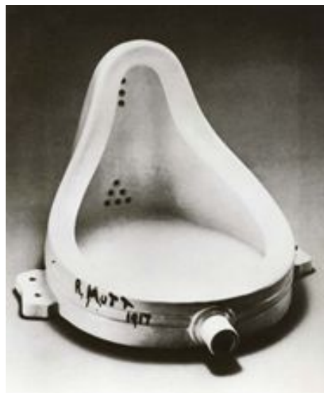
Imagen 1. “La Fuente” 1917, Marcel Duchamp. Escultura.

El dadaísmo se agrega al panorama artístico, aboliendo la configuración formal tradicional y el abuso de las obras, y abogando por el arte de la oportunidad, que se burla de la figura del autor y de cualquier arte institucionalizado autoritario en escena.