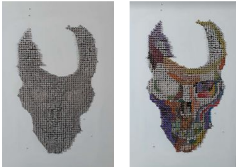
Imagen 12: fondear con óleo blanco los tornillos para luego darle color uno por uno.