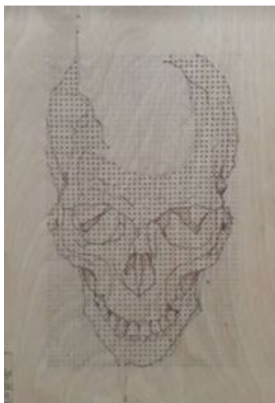
Imagen 10: perforación del patrón de punto a punto.