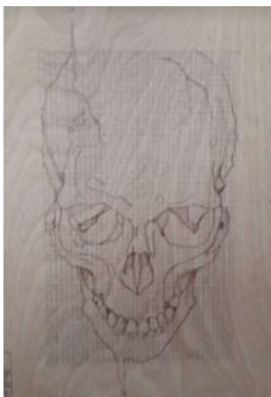
Imagen 9: realización del patrón para la perforación.