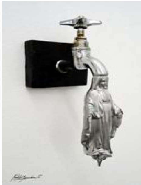
Imagen 3, "Aparición milagrosa de la Virgen de agua sucia". Pablo Gamboa. Arte Objeto

Entre los artistas nacionales encontramos a Pablo Gamboa Santos con su obra "Aparición milagrosa de la Virgen de agua sucia", donde el artista trabaja con el concepto del reciclaje, otorgando un valor estético y funcional más allá de lo reutilizable.