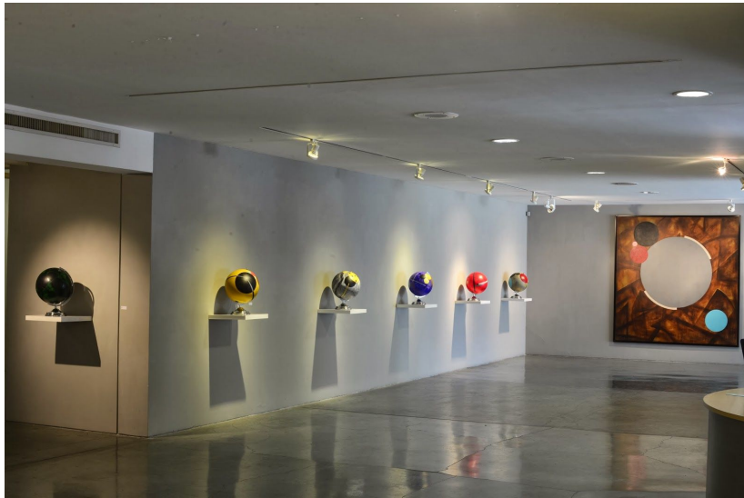
Imagen 5, “Composición 1.5” 2013. Xavier Patiño. Objeto acrílico

que pertenece una persona. Estas diferentes formas constituyen la cultura estética que todos tenemos