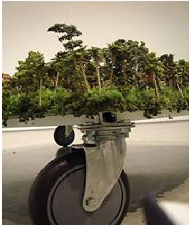
Imagen 4, “Tiwintza Mon Amour” 2005, Manuela Ribadeneria, Técnica mixta sobre ruedas