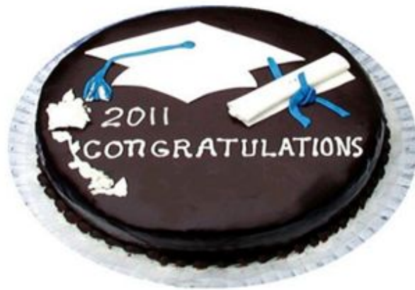
Imagen 6 , “Homenaje” 2011. Henry Acaro. Arte objetual/Performance