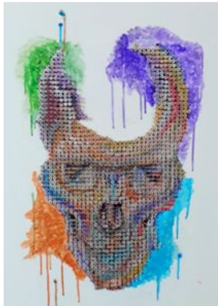
Imagen 13: Trabajo finalizado.

Es muy importante destacar toda la experiencia adquirida durante el proceso de trabajo, que hace que el proceso de producción sea conforme y al mismo tiempo prueba los materiales seleccionados para determinar el concepto y desarrollo clave de la obra y obtener los mejores resultados.