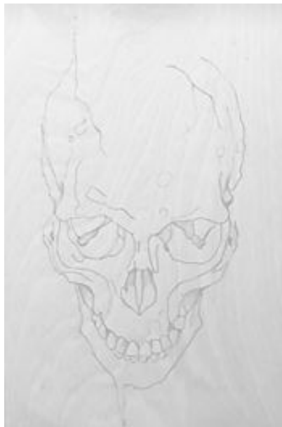
Imagen 7: boceto escogido para la muestra artística.

Como símbolo de representación se utilizó tornillos, la obra es una escultura tradicional a pesar de ser contemporánea, porque es hecha a mano jugando con las dimensiones de bajos relieves, sin la necesidad de utilizar la tecnología o un patrón de píxeles que facilite su elaboración.