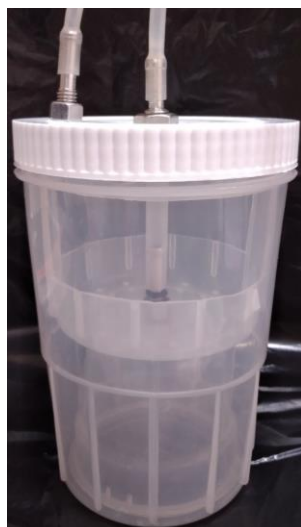
Fig. 1 Prototipo de SIT (PSIT)