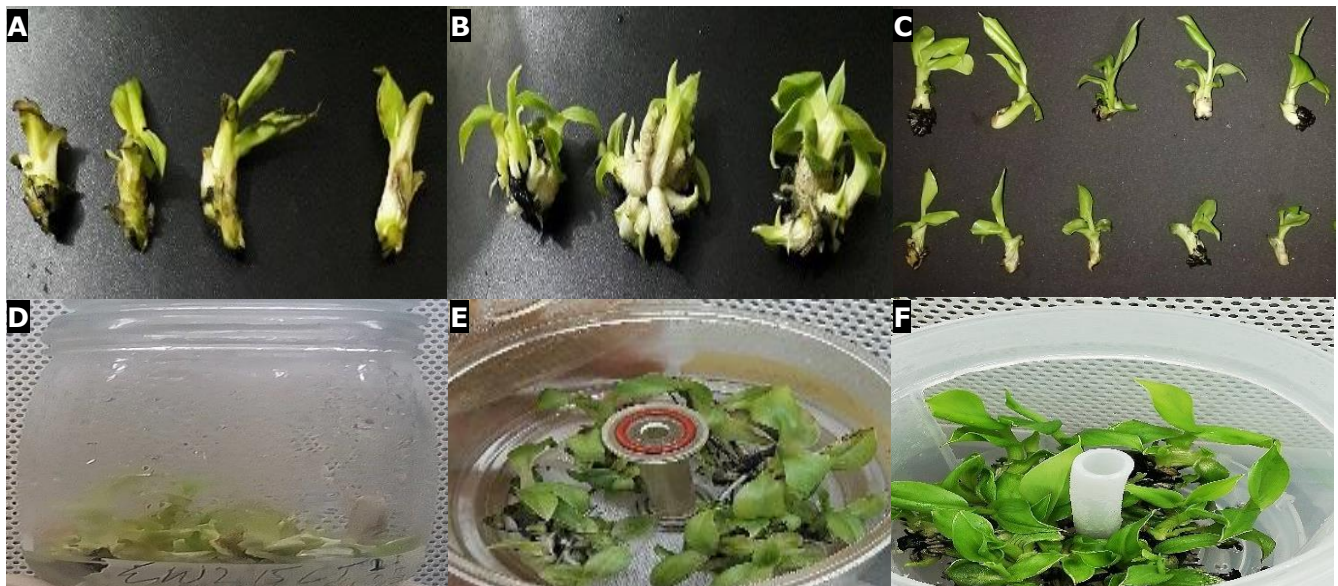
Fig. 2 Resultados de 21 días de multiplicación de banano ( Musa . AAA cv. Williams) en distintos sistemas de cultivo in vitro : SS (A, D), RITA® (B, E), PSIT (C, F).

De esta forma, el uso del PSIT propuesto en nuestro estudio aumentó la eficiencia de la multiplicación, al permitir inocular un mayor número de explantes (9) en comparación con RITA® (4) y SS (4), para obtener un número similar de brotes tipo I (9.81) en cada ciclo de forma sucesiva.