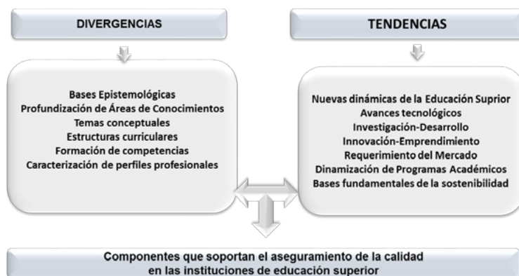
Figura 1. Proyección de las bases de la formación tecnológica

Resulta evidente, las divergencias entre la proyección de las bases que soportan la formación tecnológica, las cuales parten con la identificación de las epistemologías que determinan la profundización de las diversas áreas de conocimiento. Asimismo, se destaca la visión conceptual, la cual se soporta mediante estructuras curriculares, que buscan el fortalecimiento y desarrollo de competencias, según se indica: