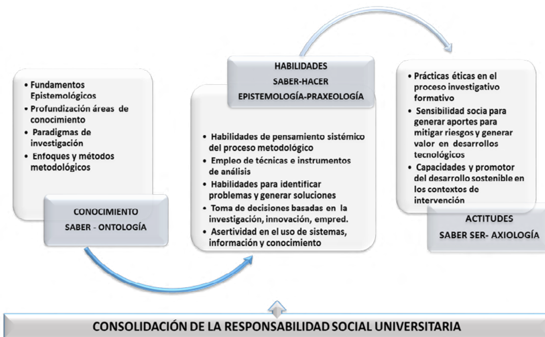
Figura 2. Relación sistémica de competencias-paradigma científico y los componentes de desarrollo

La sistematización de competencias presentadas, se plantean desde la visión de consolidar el precepto de RSU, su estructura contribuye a responder la interrogante sobre ¿cómo se logra la interrelación programas académicos-enfoques metodológicos? Sin embargo, la viabilidad desde el contexto y las variables de estudio, se logrará adoptar, siempre y cuando se afiance el relacionamiento de la universidad con los entornos de intervención Universidad-Empresa-Estado-Sociedad con proyección global.