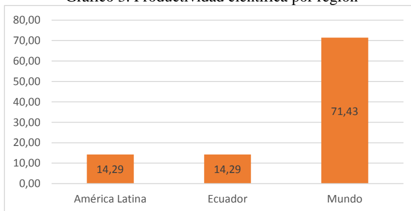
Gráfico 3. Productividad científica por región

Las publicaciones científicas investigadas procedieron de diferentes partes del mundo, sin embargo, solo el 14,29% han sido realizados en Ecuador y en América Latina, el 71,43% restante han sido realizadas en otros países del mundo.