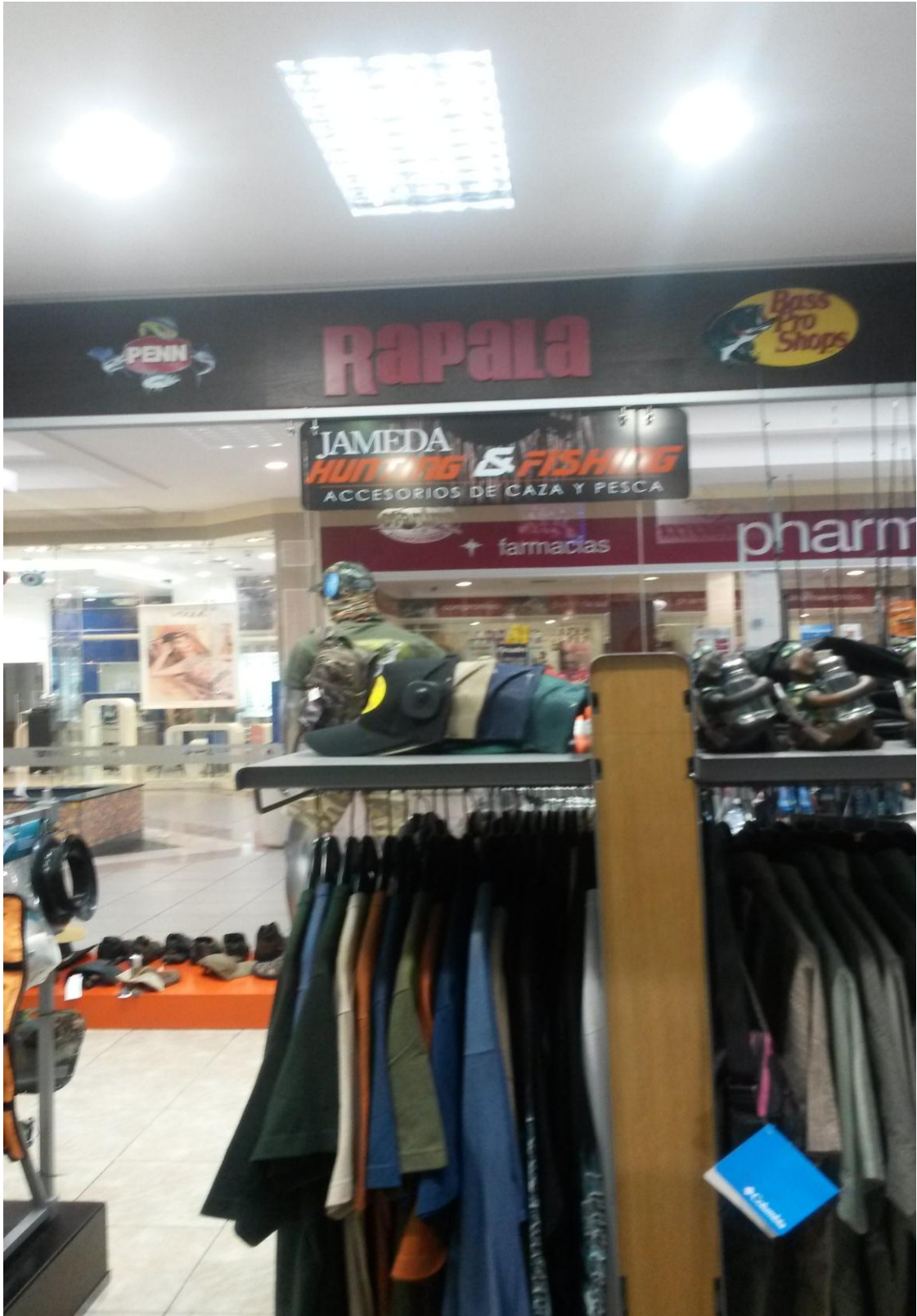
Grafico 2: Productos del local de Machala. (Jameda. 2015).