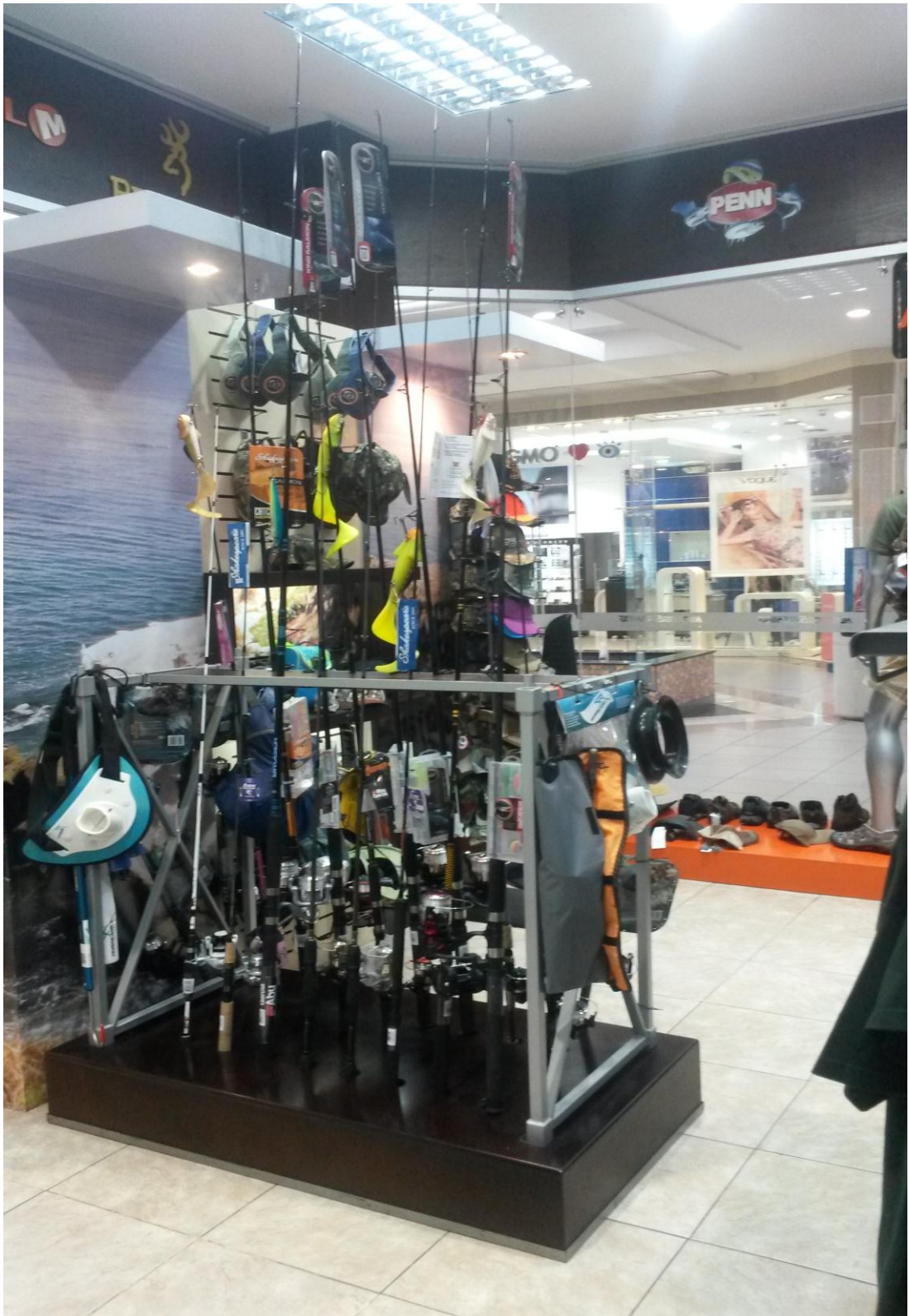
Grafico 3: Productos del local de Machala. (Jameda. 2015).