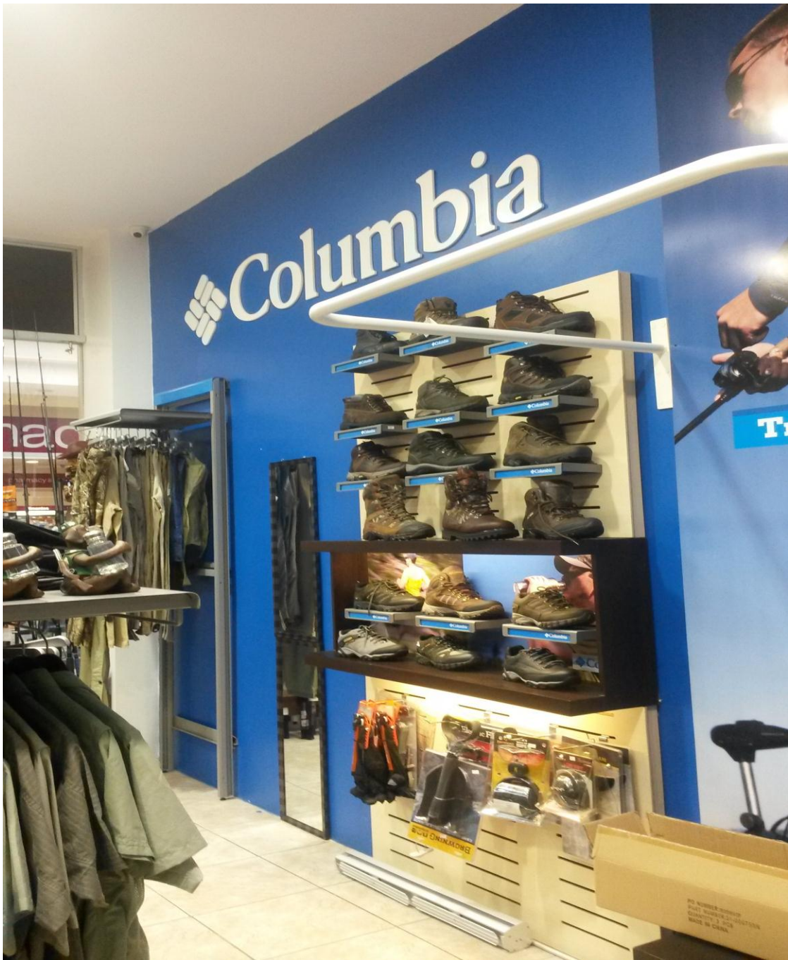
Grafico 1: Productos del local de Machala. (Jameda. 2015).