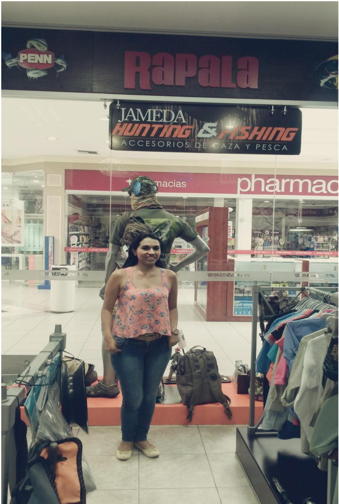
Grafico 5: Productos del local de Machala. (Jameda. 2015).