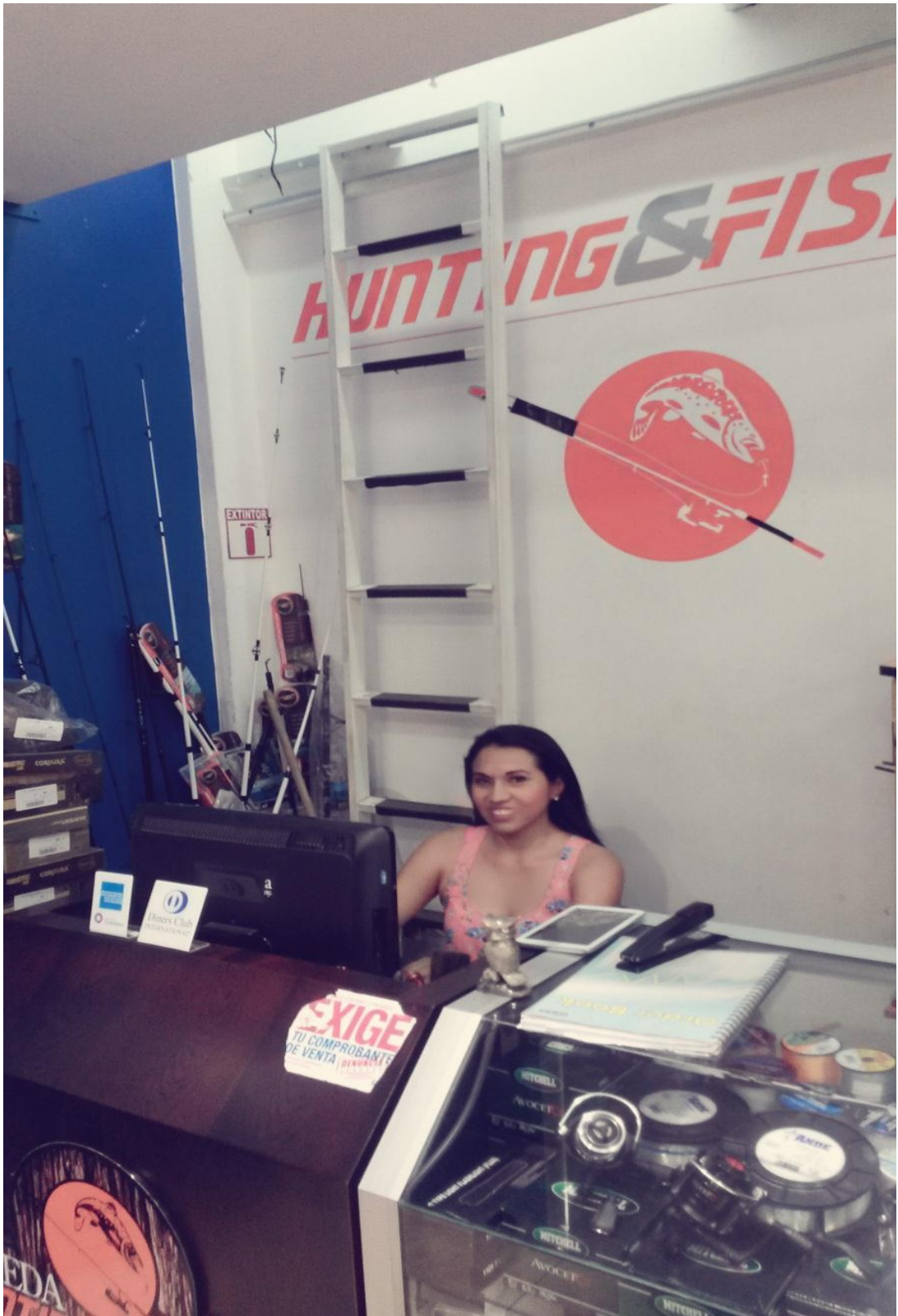
Grafico 4; Productos del local de Machala. (Jameda. 2015).