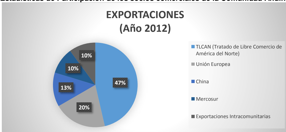
Figura 3. Porcentaje participativo de exportaciones (año 2012) entre la Comunidad Andina y el resto del mundo, Elaborado por: Kendry Miguel Aguirre Palacios