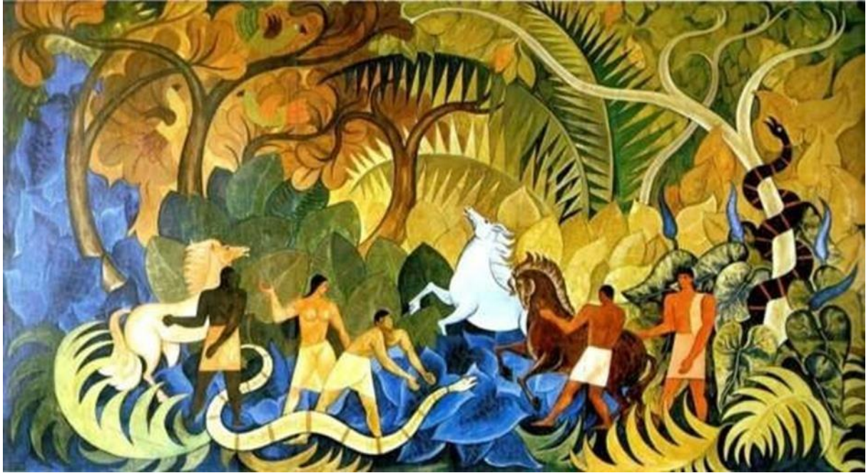
Figura 6: Mural de la Selva, Guayasamin,1949.