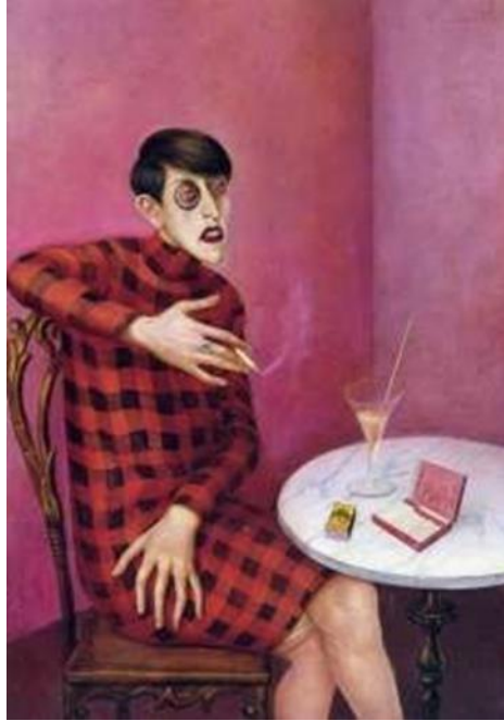
Figura 4: Retrato de la periodista Sylvia Von Harden, Otto Dix, 1926.