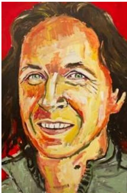
Figura 8: Retratos.