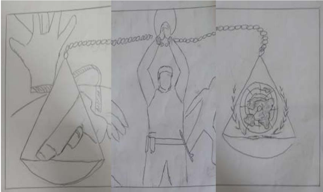
Figura 11: Aproximación Grafica I