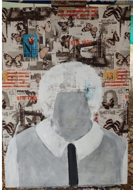
Figura 15: Segundo avance del cuadro #1.