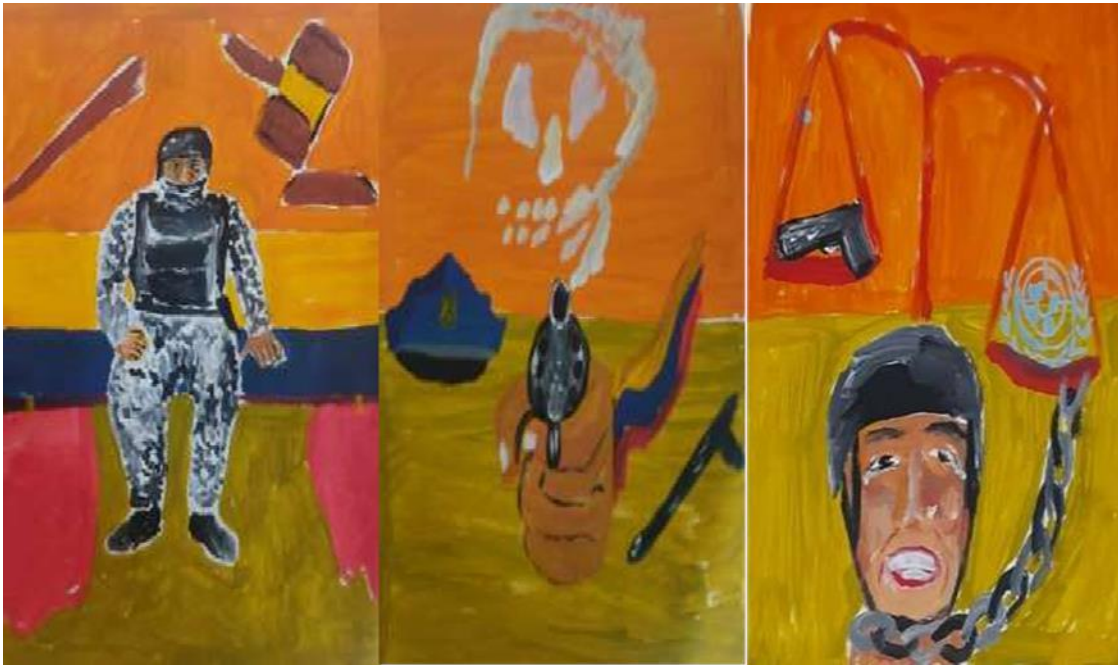
Figura 12: Aproximación Grafica II.