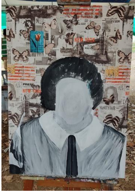
Figura 16: Tercer avance del cuadro #1.