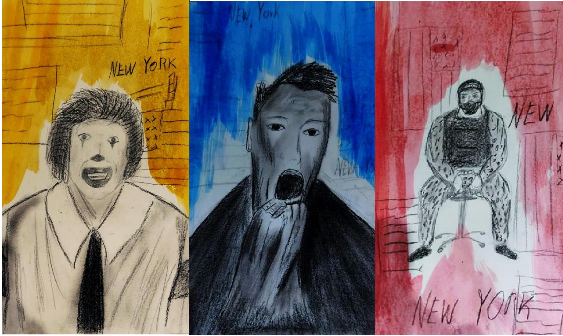
Figura 13: Aproximación Grafica III.