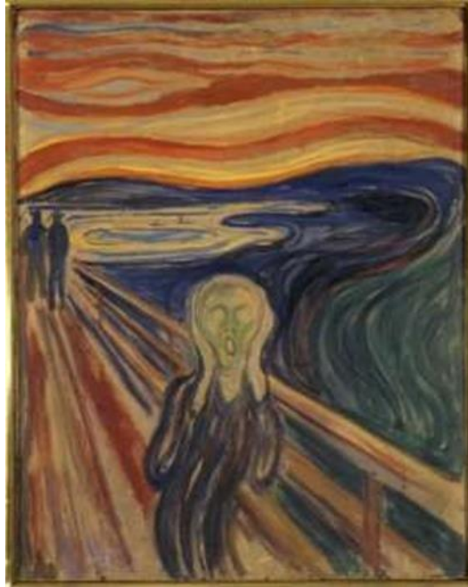
Figura 3: El grito, Edvar Munch, 1893.