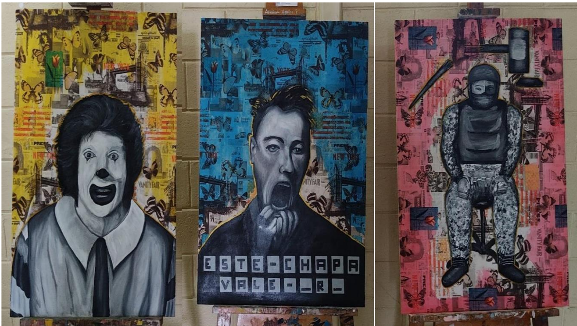
Figura 23: Obra culminada.

Dicha propuesta será expuesta en el auditorio de la Universidad de Técnica de Machala, en la facultad de Ciencias sociales el 2 de febrero del año 2023.