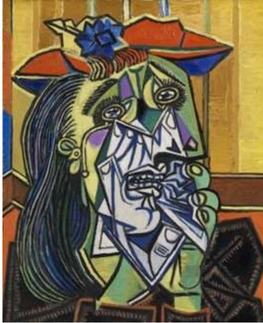
Figura 2: La mujer llorando, Pablo Picasso, 1937.