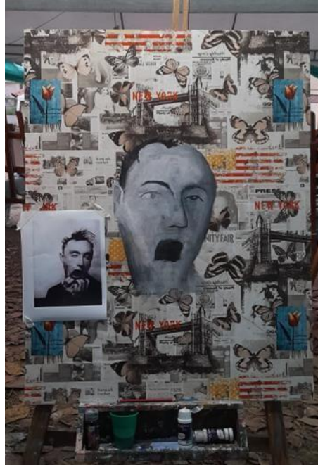
Figura 19: Tercer avance del cuadro #2.