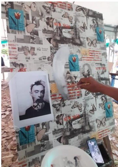
Figura 18: Segundo avance del cuadro #2.