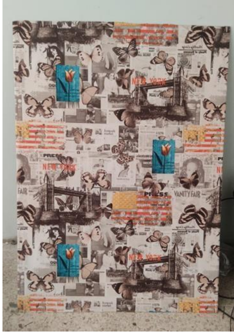
Figura 17: Soporte de la obra #2.