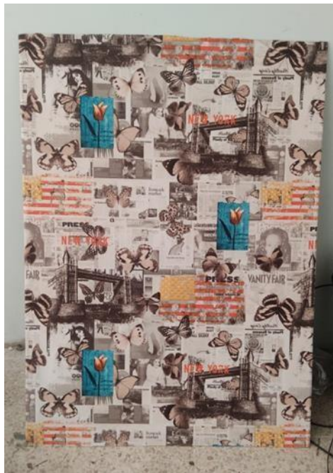
Figura 14: Soporte donde se realizó la propuesta #1

Esta propuesta contiene 3 obras diversas que se complementan (Tríptico). Continuamente se pone a evidencia las imágenes captadas del proceso de construcción de la obra.