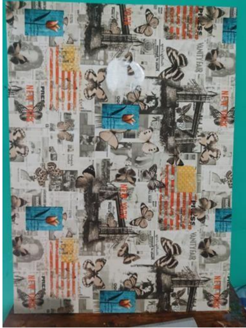
Figura 21: Segundo avance del cuadro #3.