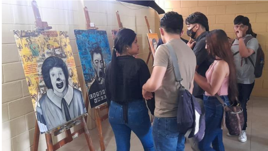
Figura 24: Fotografía acerca de la obra expuesta al público.