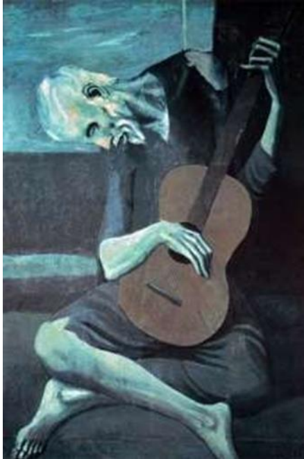
Figura 1: El viejo guitarrista ciego, Pablo Picasso, 1903