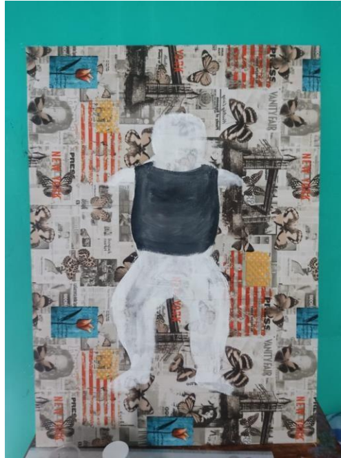
Figura 22: Tercer avance del cuadro #3