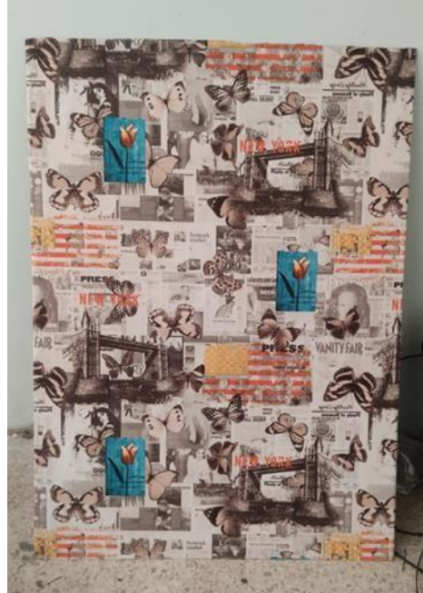
Figura 20: Soporte del cuadro #3.