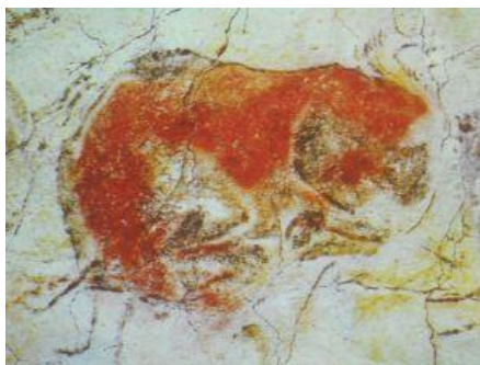
Figura 1: Arte de Altamira