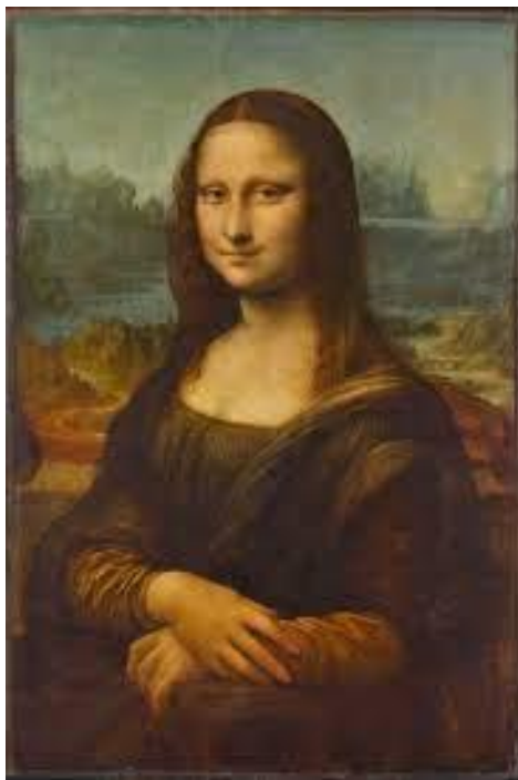
Figura 2: La Gioconda, Leonardo Da Vinci

Todo lo intentó, todo lo quiso, lo que podía y lo que no podía. Y le quedaba un desencanto melancólico que luego intentaba en los labios de sus figuras, como en la Gioconda. Y como la Gioconda, todos sus semblantes sonríen para no llorar, sonriendo de hastío y de descontento, sonríen para no acabar de morir. (Cataluña, 2019)