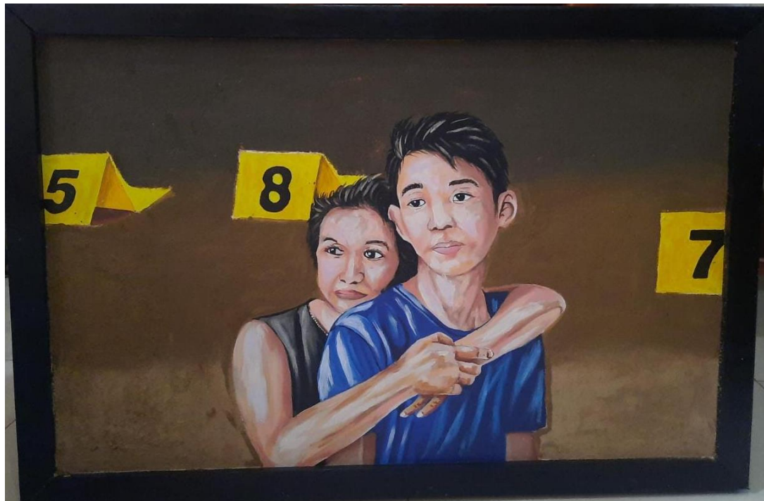
Figura 22: Acabado final.