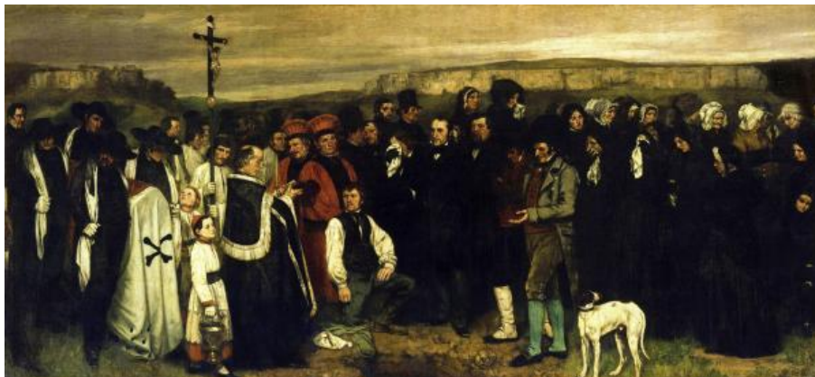
Figura 5: Entierro en Orans 1849. Óleo sobre lienzo, Gustave Courbet.

(Herrerias, 2021)menciona: Pero no es fácil, recuerda Ortega, distanciarse de la realidad en el arte, y más aún, deshacerse de la realidad, pero lo importante es subrayar que lo que Ortega define como deshumanización del arte significa un punto de vista diferente al del artista tradicional que mira siempre hacia el objeto humano.