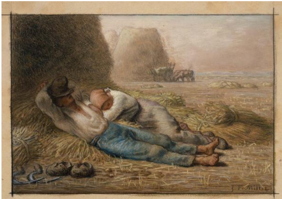
Figura 7: Descanso al mediodía Millet (1866).

El fundador de la Escuela Barbizon, Miller fue otro padre del realismo. En su obra muestra admiración por los agricultores y humildad ante el deterioro de las condiciones de vida en las ciudades industrializadas. Millet, de Normandía, no vio reconocida su obra en París, lo que le llevó a alejarse de las tendencias oficiales y trasladarse a Barbizon, donde creó una escuela de paisajista, destacada por su interés por la naturaleza y un estilo más místico. Sus principales obras incluyen: La comida de los segadores (1853), Las espigadoras (1857), El Ángelus (1859) y Descanso al mediodía (1866).