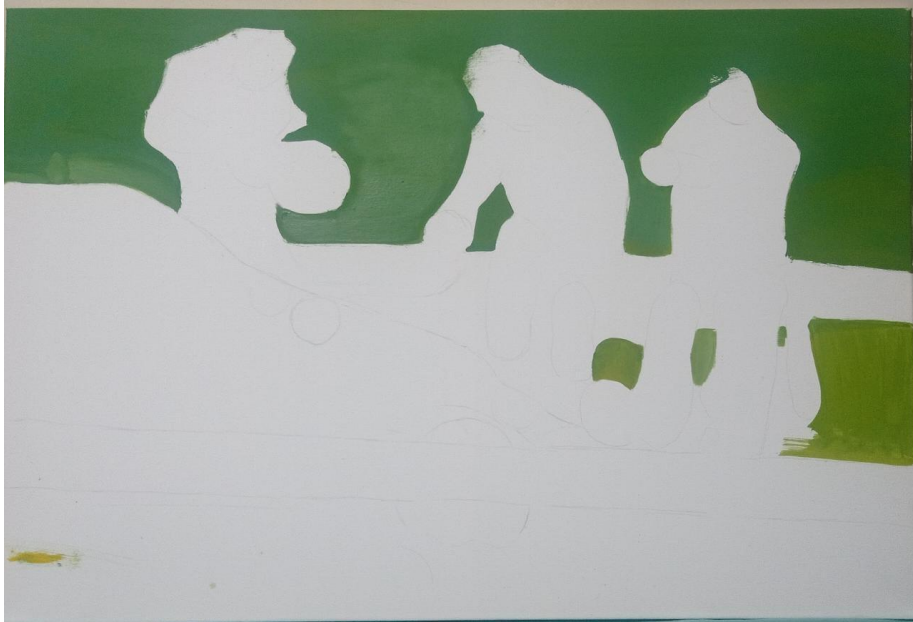
Figura 19: Pintura #3. Avance 1 de la pintura titulada “Luto en Ecuador”.