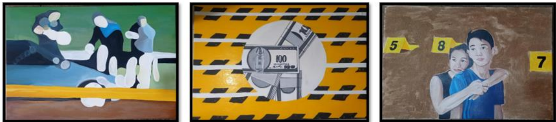
Figura 21: Propuesta final.

Una vez culminada la obra, se procederá a la presentación para desarrollar el abordaje crítico, tomando las diversas opiniones y críticas del público en general.