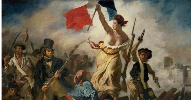
Figura 3: La libertad guiando al pueblo o El 28 de julio, 1831