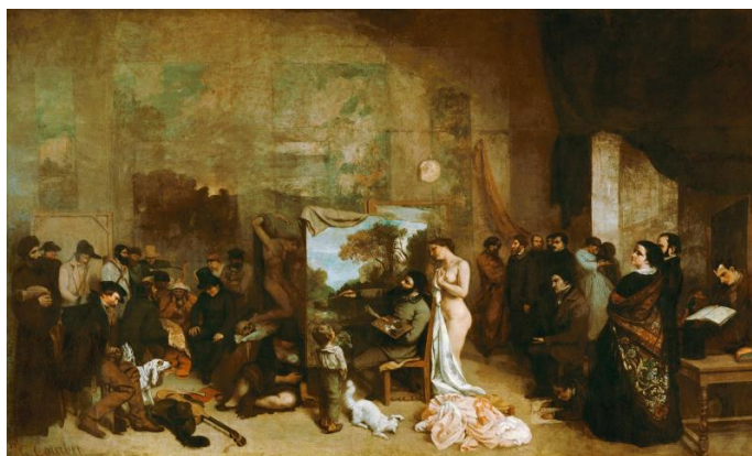
Figura 10: L'atelier du peintre.

El arte a través de la pintura tiene un fin y es aportar al desarrollo social y en este caso partiendo de la pintura realista la cual nació en la segunda mitad del siglo XX en rebelión en contra de la fantasía, exotismo, romanticismo y el idealismo. Además, como referencia para este tríptico se toma a Gustavo Courbet uno de los principales representantes del realismo ya que rechaza la idealización de la realidad, poniéndose a favor de la visión naturalista, el cual es una de las características principales que se aplicara en la obra.