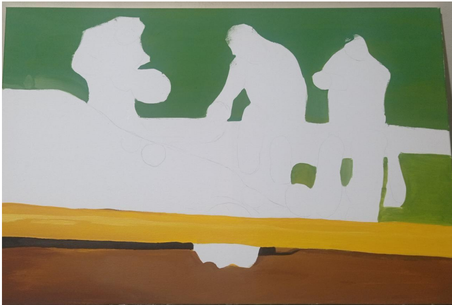
Figura 20: Pintura #3. Avance 2 de la pintura titulada “Luto en Ecuador”.