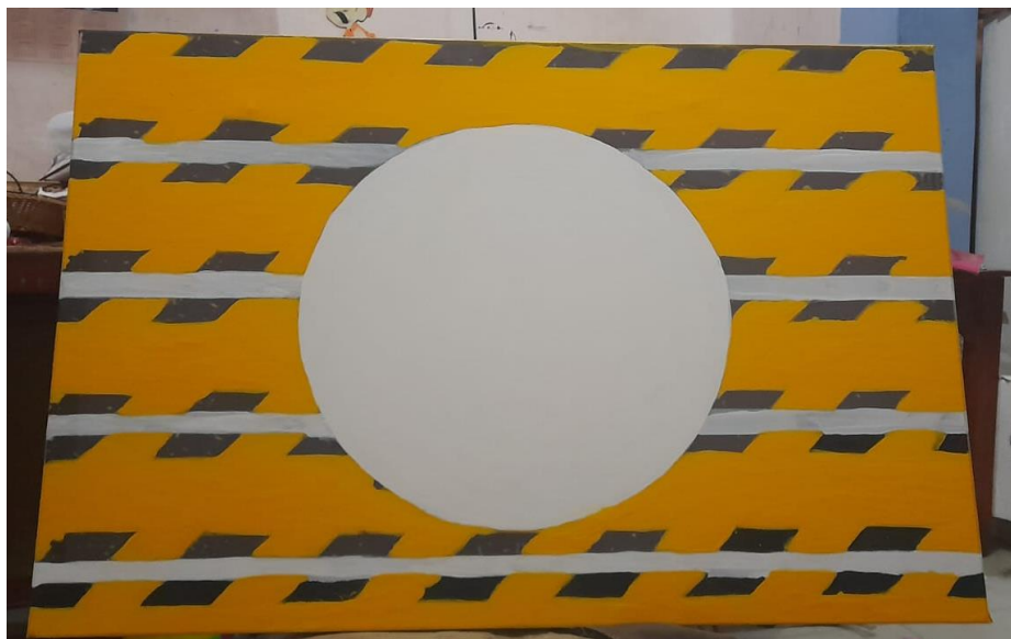
Figura 17: Pintura #2. Avance 1 de la pintura titulada “Luto en Ecuador”.