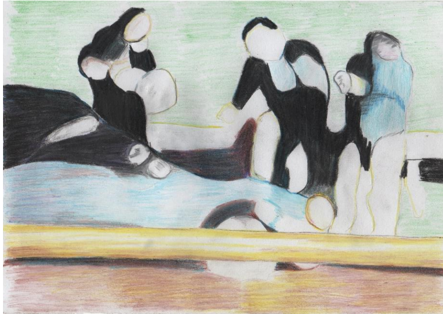
Figura 11: Aproximación grafica 1.