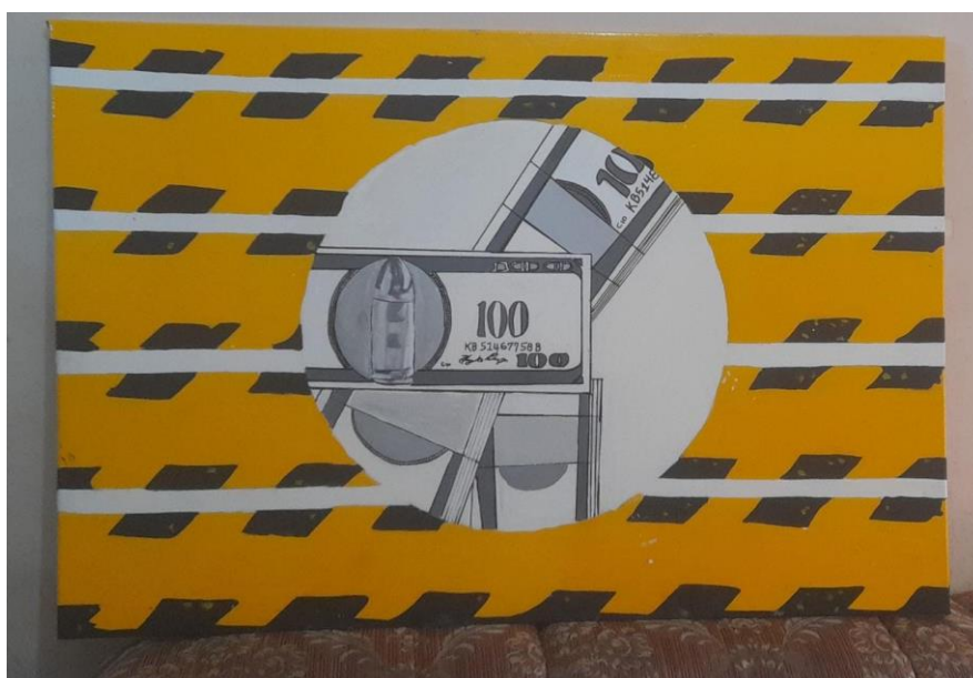
Figura 18: Pintura #2. Avance 2 de la pintura titulada “Luto en Ecuador”.