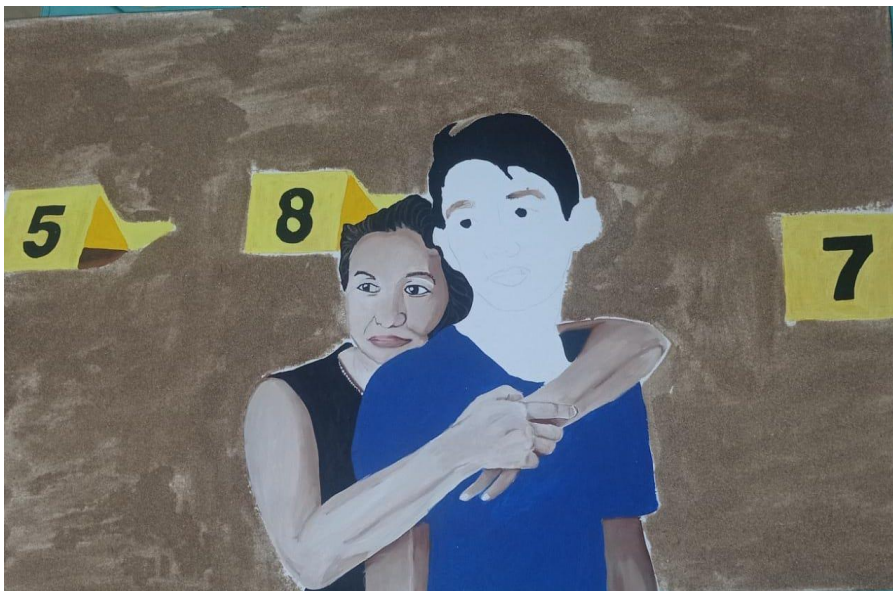
Figura 16: Pintura #1. Avance 3 de la pintura titulada “Luto en Ecuador”.