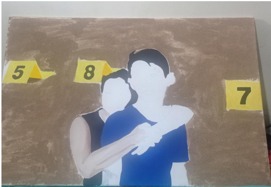
Figura 15: Avance 2 de la pintura titulada “Luto en Ecuador.”