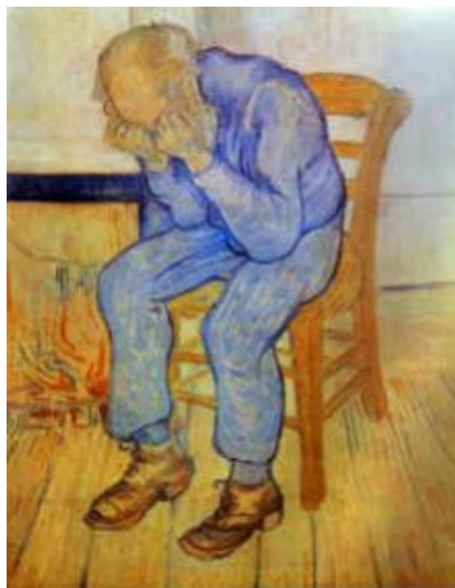
Figura 6: “Anciano en pena (en las puertas de la eternidad)” Vicent Van Gogh, 1890.

(Miño Palacios, 2018) Menciona que: existen diversas formas de representar el arte, y una de ellas es la intervención artística, la cual es una manifestación realizada por personas que presentan en un determinado espacio público, a través de murales, esculturas, performances, pinturas, entre otros, e incentivan a la reflexión, a la vez que indirectamente contribuyen con el disfrute del público.