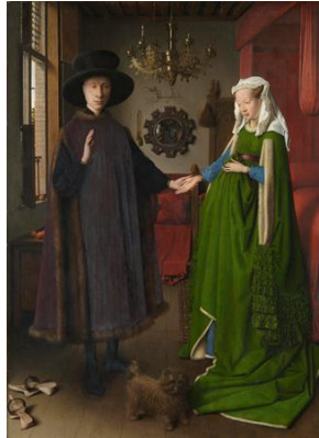
Figura 4: "El Matrimonio Arnolfini", (1434). Jan van Eyck.

Los primeros en lograr la hazaña de dominar la técnica al óleo luego de que varios artistas lo intentaron fueron los hermanos Van Eyck y fue de una manera accidental al exponer la pintura al sol y que para el día de hoy ya no se usa mucho y se opta por el acrílico.