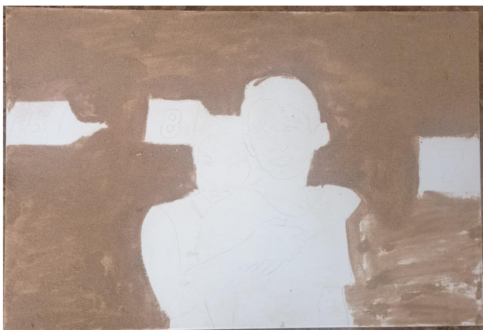
Figura 14: Pintura #1. Avance 1 de la pintura titulada “Luto en Ecuador”.

A continuación, se detalla con imágenes el proceso del tríptico: