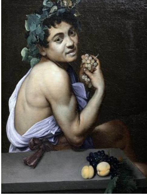
Figura 9: Baco enfermo 1593-1594 de Caravaggio.