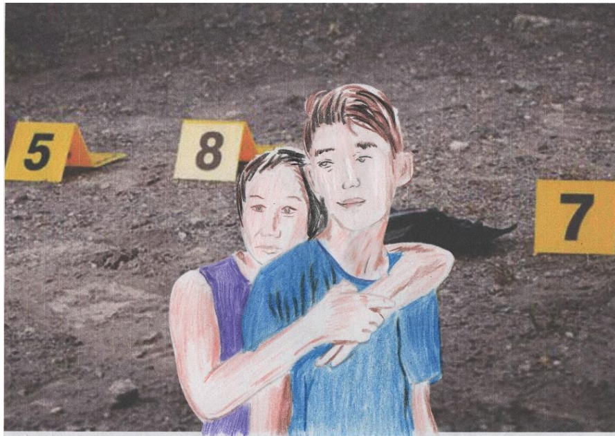
Figura 13: Aproximación grafica 3.