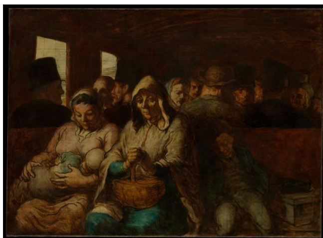
Figura 8: Carruaje de tercera clase de Honoré Daumier (1864)

Entre sus obras del Realismo se destacan: El compartimento de primera clase, sus caricaturas para revistas como “La Caricaturé” y “Le Charivari”, así como a obra “Rue Transnonain”, publicada el 15 de abril de 1834 en la Revista Association Mensuelle.