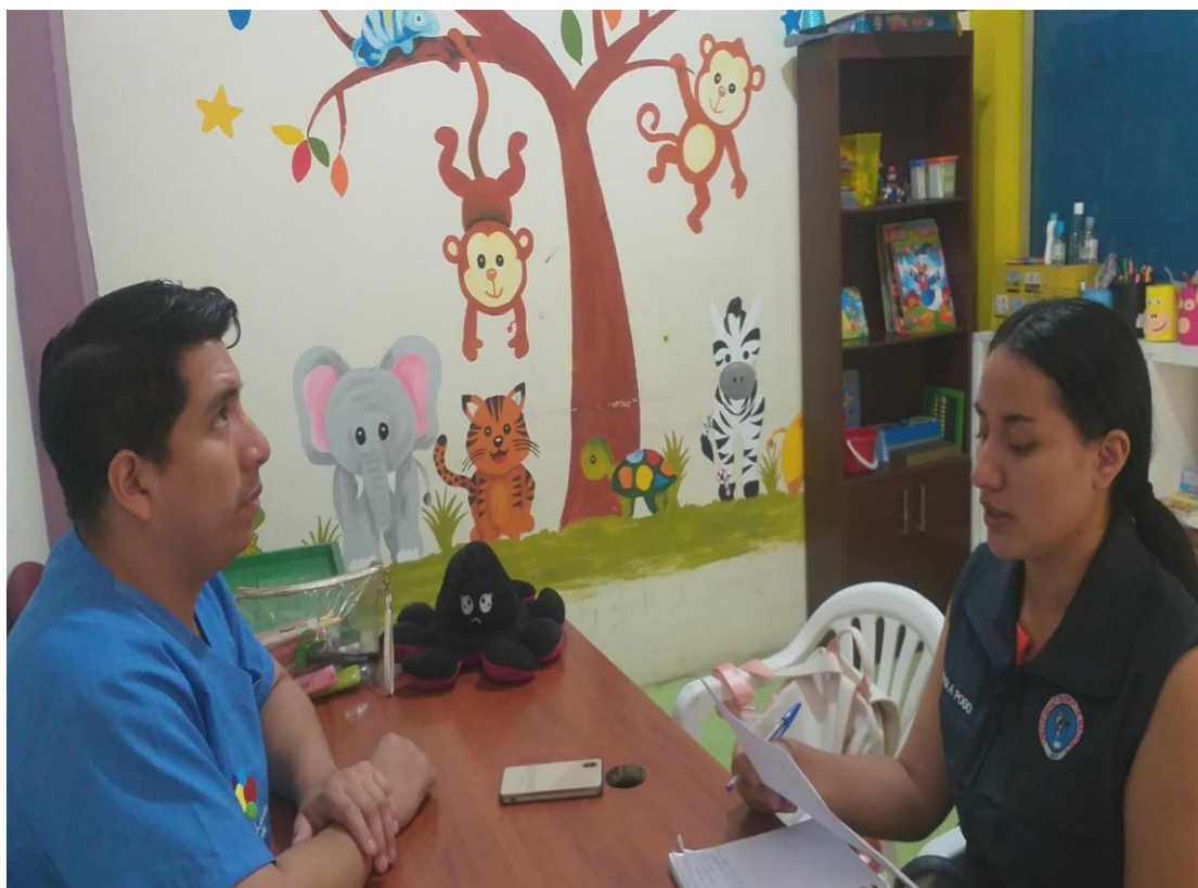
Fotografía 1: Entrevista con el Equipo Interdisciplinario.