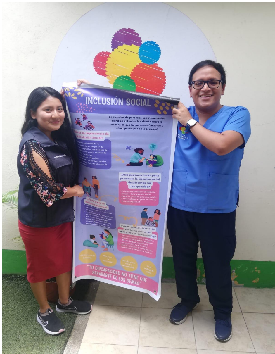
Fotografía 4: Entrega de la Guía de Información