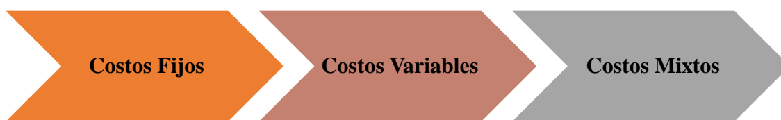
Ilustración 2. Clasificación de los costos