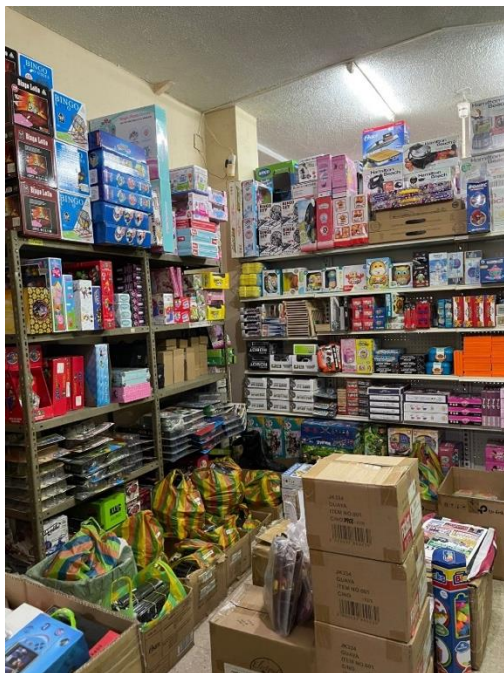
Bodega de juguetes