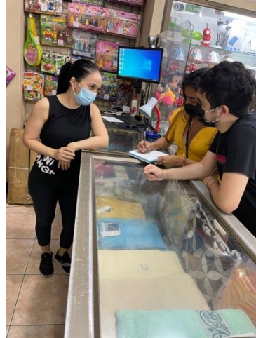
Entrevista a empleado del almacén “Electrocapi”