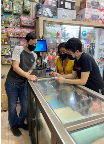
Entrevista a gerente del almacén “Electrocapi”