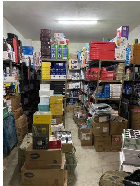
Bodega de productos varios.