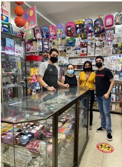
Visita a local comercial “Electrocapi”