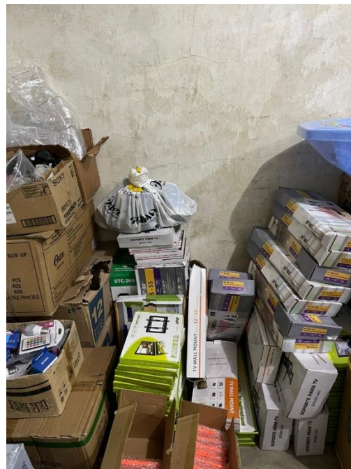
Deficientes condiciones de la bodega