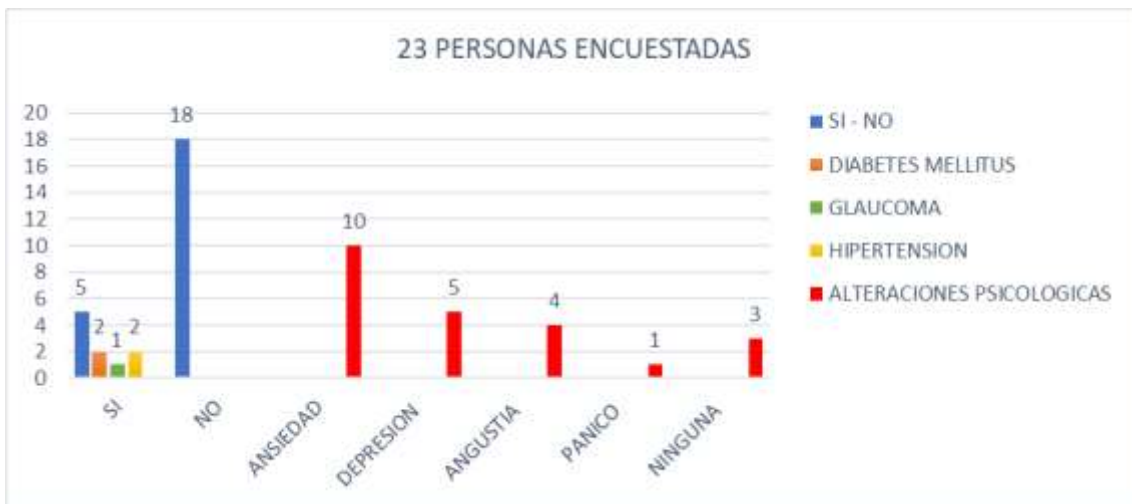
Gráfico 3: ¿Presenta usted alguna patología? Si su respuesta es sí, ¿indique cuál?, Durante la pandemia por SARS-COV-2 ¿Cuál de las siguientes alteraciones psicológicas ha presentado?