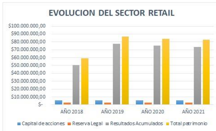
Representación de datos 1 Evolución sector retail 2018-2021