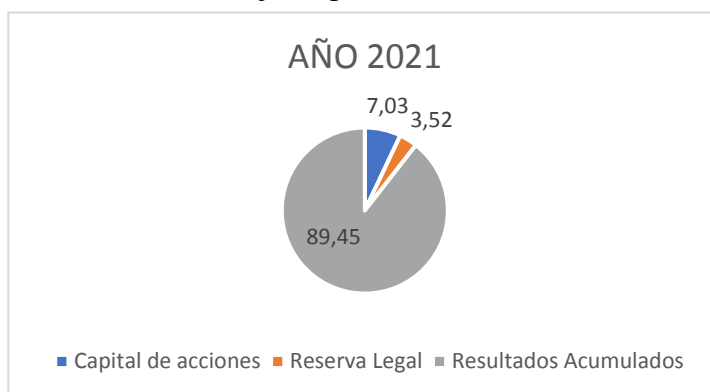
Gráfico 2 Porcentaje de patrimonio año 2021

Al obtener los datos del periodo 2020 y 2021, se encuentra como resultado que, al pasar de un año, debido al confinamiento por la pandemia, y el poco consumo de productos para ser comercializados en el sector retail específicamente en los supermercados tiene una pérdida que no ha sido de gran consideración; el cual se pueden observar dentro de los resultados acumulados mostrando una recesión económica en los periodos antes mencionados