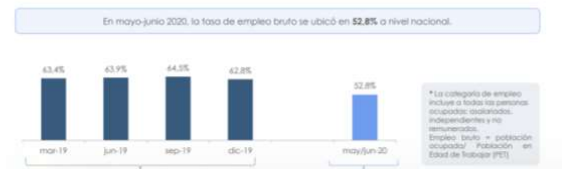
Ilustración SEQ Ilustración \* ARABIC 4 Tasa de empleo a nivel Nacional