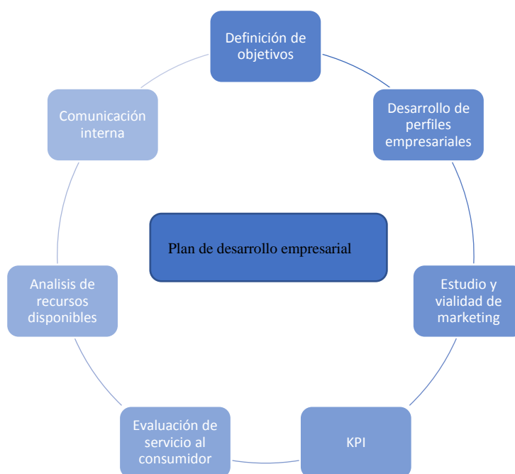
Ilustración 1. Esquema de un plan de desarrollo empresarial

El desarrollo de un plan empresarial para la empresa BIOEXPORT, es uno de los objetivos específicos establecidos. Un plan empresarial se tiene que tomar en cuenta una serie de pasos y rigurosos procedimientos para no caer es una ineficacia y no cumplir con las expectativas de los consumidores.