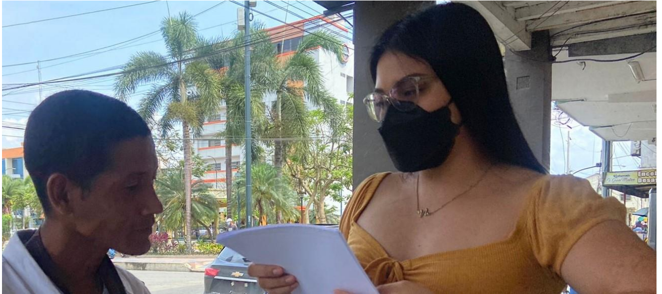
Zona estudiada (Callejón de la Muerte)