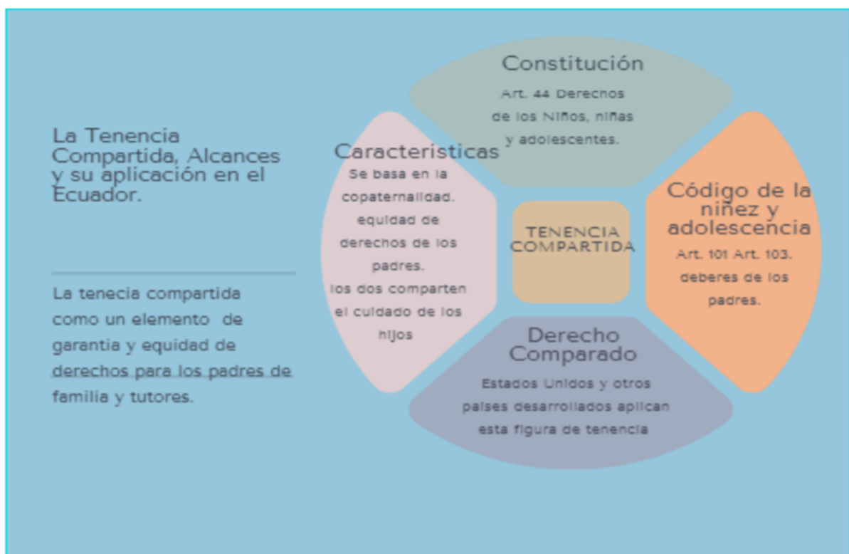
Ilustración 2. Tenencia compartida caracterización en el Ecuador

De acuerdo con Murillo y Vázquez (2020), la constitución se acopla a un Estado de derecho pero sus leyes no se acoplan del todo, debido a que se basa en roles de género autoimpuestos como la madre cría y el padre provee; vulnerando derecho a la familia al usar la tenencia unilateral desde el momento en que se creó dicha figura sin considerar la realidad social del caso; por ende, una mejor solución es aplicar la responsabilidad mutua en caso de no llegar a un acuerdo entre padre e imponer tanto horarios de visita flexibles como pensión económica para garantizar la convivencia en familia y respetar el derecho del padre a estar con su prole sin confundir custodia con tenencia.