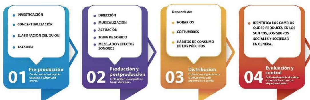
Gráfico 1.- Proceso de producción radial