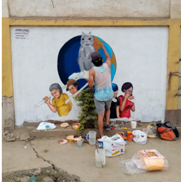
Imagen 13: finalizando y dando retoques a la obra artística.