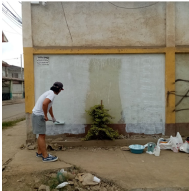
Imagen 8. Se procede a pintar y blanquear la pared con pintura supercorona.

Teniendo en mente el trabajo final práctico, se llevó a cabo el investigar la problemática y varios artistas que dieron este movimiento artístico que es el muralismo, con todo esto se procede a realizar el trabajo final, después de hacer bocetos que conecten el mensaje que se quiere dar al público.