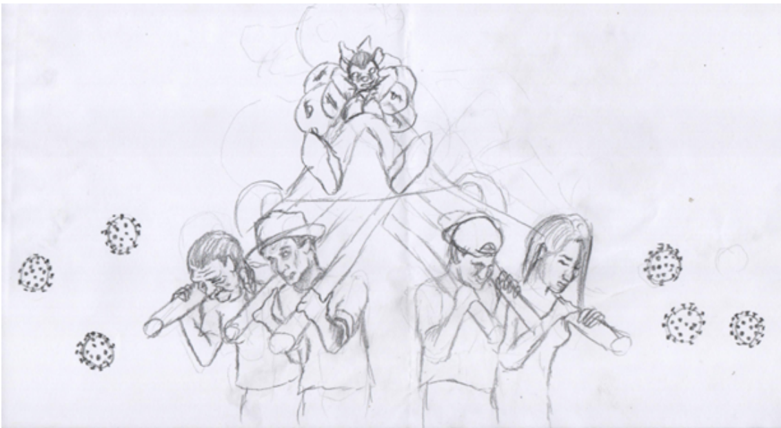
Imagen 4: bocetos preliminares en base al problema social.

Al finalizar el trabajo teórico investigativo, procedemos a la realización de la obra artística. Se desarrollan todos los bocetos que se han hecho mediante todo el trayecto del trabajo teórico investigativo, ya que contienen referencias con el tema de la política, lo artístico y lo que se ha vivido en estos tiempos de pandemia.