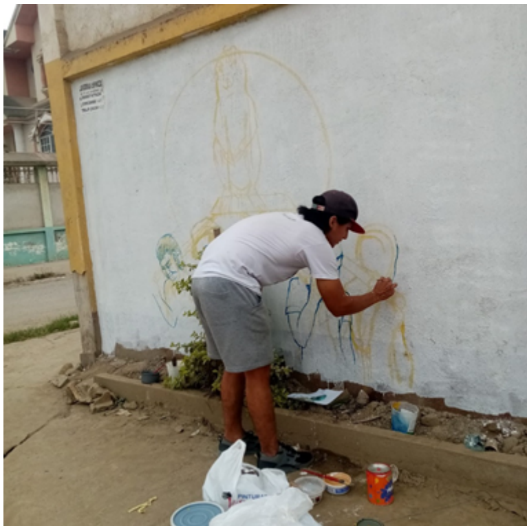
Imagen 10: realizando el boceto de la obra.