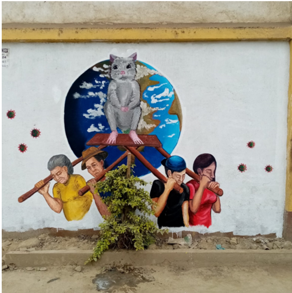
Imagen 14: Trabajo completado y finalizado.