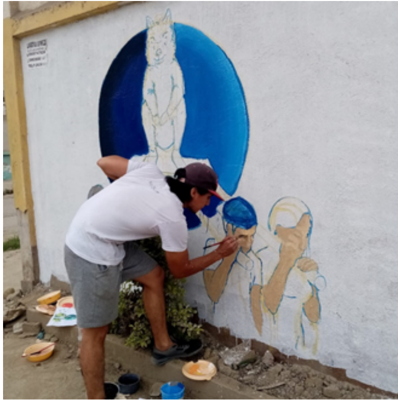
Imagen 11: detallando los personajes que conforman la obra artística.