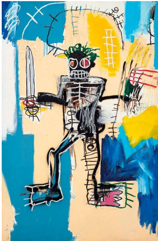
Figura 3. “warrior”, Jean Michel Basquiat, 1982. Fuente: https://www.actuallynotes.com/warrior-jean-michel-basquiat-417-millones-de-dolares/

En la década del siglo XX los muralistas optaron por otras corrientes como es el graffiti, pop art, cubismo entre otras, ya que ellos comunicaban a los espectadores sus obras de diferentes maneras, algo que solo los propios dueños de estas obras pueden describirlo pero para la gente es algo raro, es decir que ellos mismo saquen sus propias ideas o historias que ven en el mural donde representan figuras ya no tan detalladas o técnicas con respecto al arte clásico, ya que el arte de esta década se volvió nuevo.