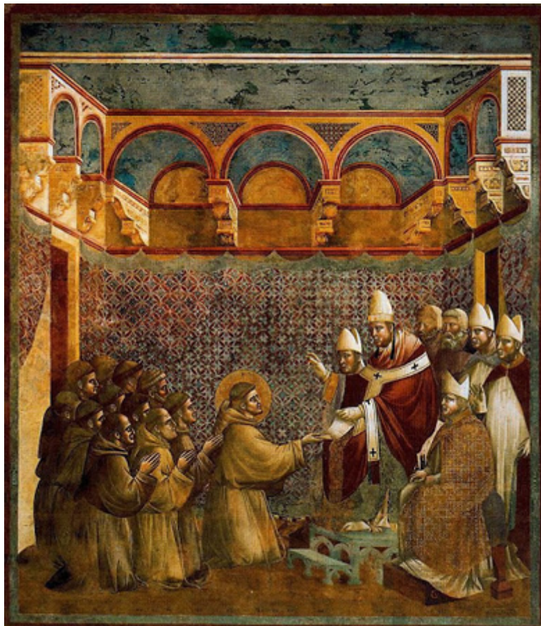
figura 2 .“Aprobación de la orden franciscana por el papa Inocencio”, Giotto, 1297

Uno de los artistas influyentes en el quattrocento en Italia fue Giotto, un artista italiano que veía la belleza en las pinturas de papas, obispos y figuras religiosas, se destacaba en la técnica del fresco, así se le llamaba a las pinturas sobre una pared dentro de un monasterio o iglesia, ya que no estaba fuera de ese lugar y es ahí que se le llama fresco. (pág.09)