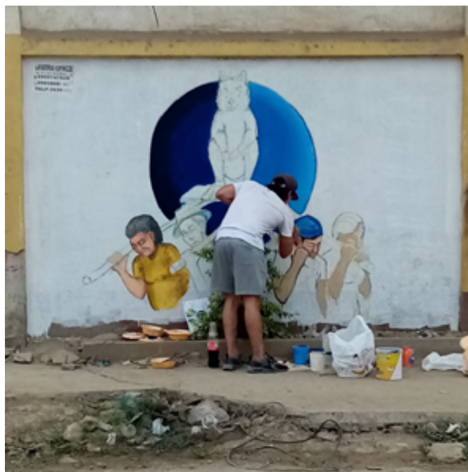
Imagen 12: detallando los personajes de la obra artística.