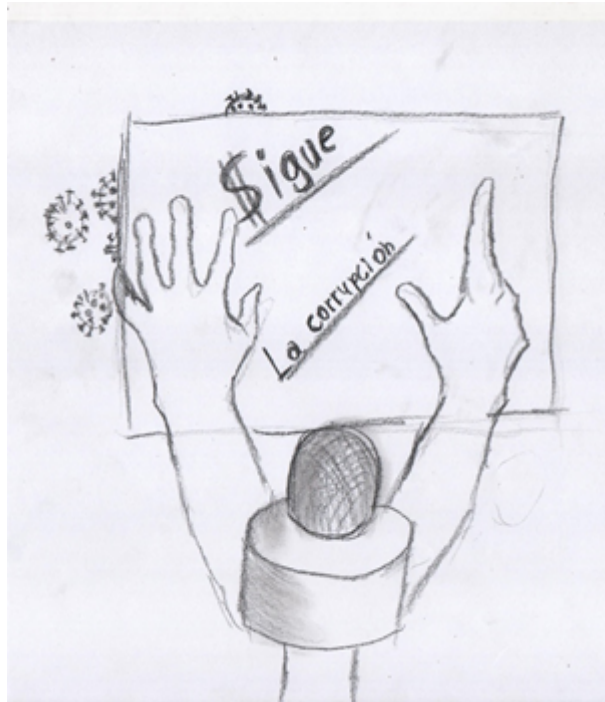
Imagen 5: bocetos preliminares de la obra artística.