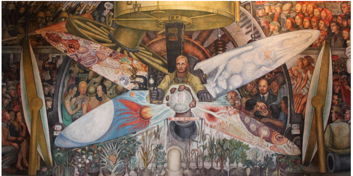
Figura 1. “El hombre entre cruce de caminos”, Diego Rivera, 1933

Fue contratado para pintar en el Rockefeller un mural en donde representa una idea que los mismos contratistas querían que fuese, pero Diego tenía un haz bajo la manga al contraponerse a esto, hizo algo diferente, algo que no les gusto a los dueños del Rockefeller, una idea que representa al nazismo, racismo y desprestigio a la gente que es manipulada por el gobierno, ya que eso hacía que la gente al momento de observar entendieran de lo que el gobierno capitalista es capaz de hacer . (Subirats, 2018)