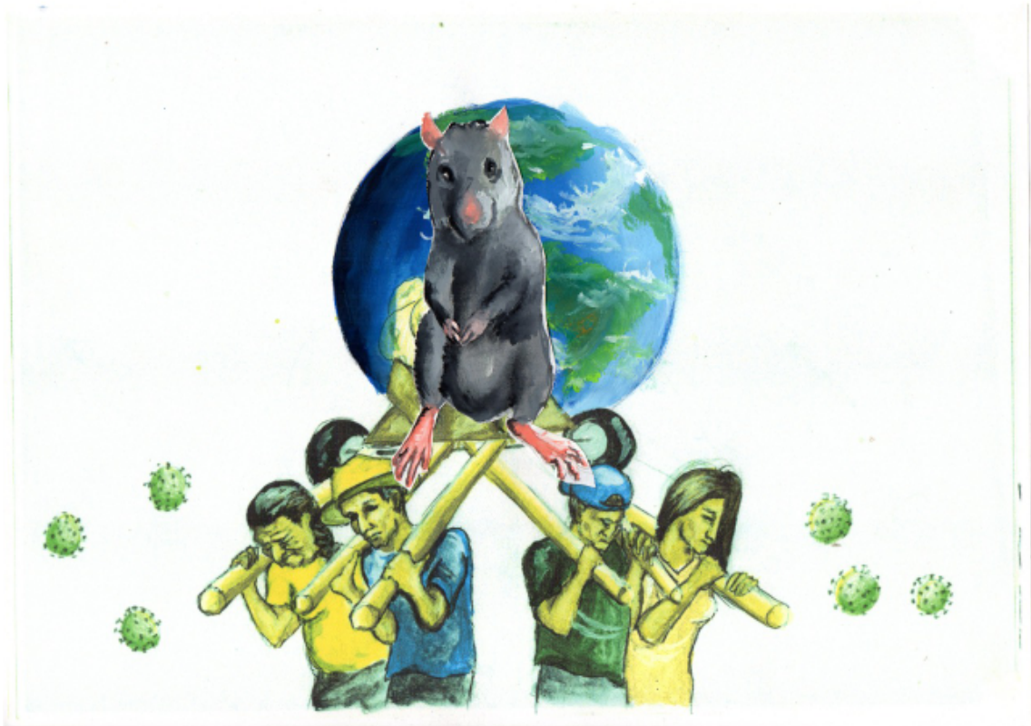
Imagen 7: bocetos preliminares de la obra artística.

Como se puede observar en los bocetos, lleva consigo muchos elementos referentes a la política, la prensa y la pandemia que se llegó a vivir desde el 2020 hasta este año, se utilizaron modelos simples que uno puede ver en algún lugar o propaganda, este tema del arte con la política es muy diverso, pero siempre con algo nuevo o de reclamo.