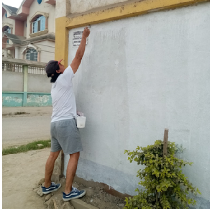
Imagen 9: procedimiento de limpieza y blanqueo de una pared.