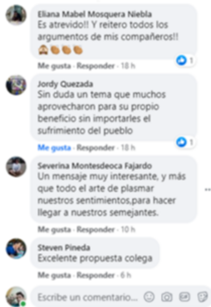
Imagen 15: comentarios emitidos por: Eliana, Jordy, Severina y Steeven.