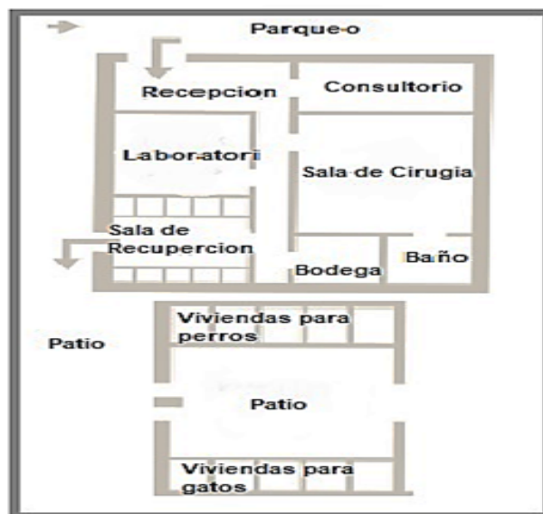
Figura 1. Modelo de Albergue