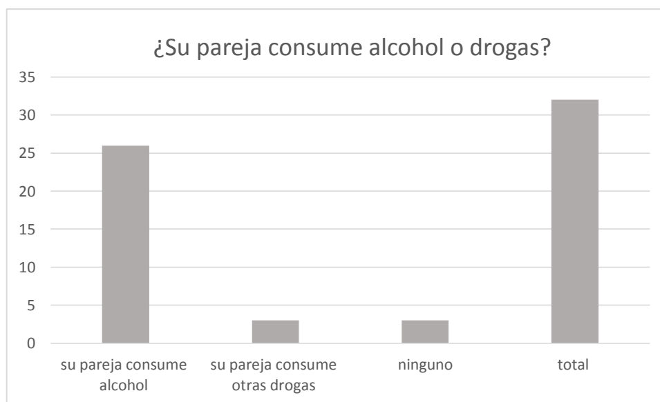
Tabla 7. Incidencia de consumo de alcohol o drogas