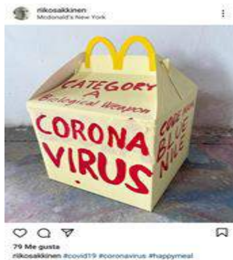
Imagen 5, biological weapon- Riiko Sakkinen - 2020

El artista Riiko Sakkinen nacido en el año de 1976, durante la pandemia compartió a través de la plataforma CAM Museo de arte covid, su obra muestra una caja que habla sobre el virus del Covid 19, la cual se ha convertido en un arma biológica que se ha esparcido alrededor de todo el mundo, tomando como referencia a la marca de Mc Donald debido a que es reconocida internacionalmente.