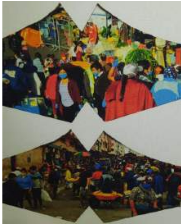
Imagen 23. Sublimación de mascarillas