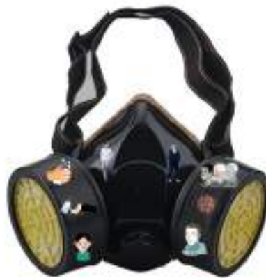
Imagen 11. Boceto digital de mascarilla de gas con imágenes de covid