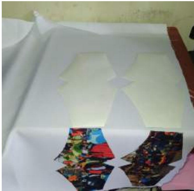
Imagen 21. Preparación de las mascarillas