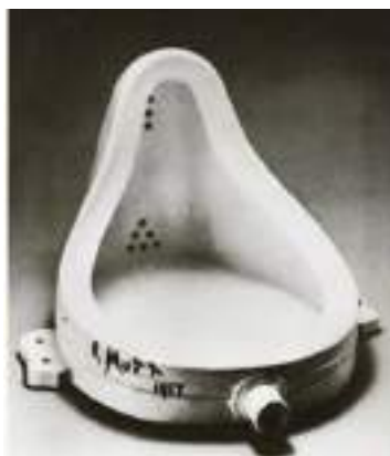
Imagen 2, La fuente- 1917, Marcel Duchamp. Escultura.

La siguiente obra de Marcel Duchamp se basó en un simple objeto tal como lo es un urinario, el cual compró y lo presentó en una exposición anual con su firma R. Mutt, provocando un gran revuelo ante los críticos y jurados presentes que se quedaron anonadados al ver como un simple urinario blanco rompía con los cánones establecidos del mundo artístico. Gracias a esta obra se dio paso a la aceptación del objeto artístico como parte de una obra de arte (Bellido, 2015)