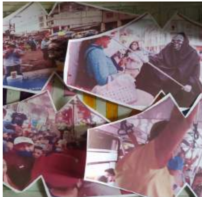
Imagen 20. Impresión de mascarillas