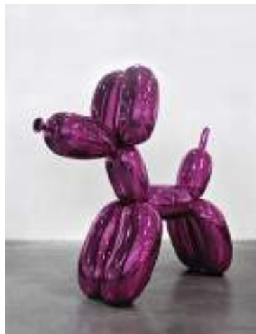
Imagen 3, Ballon Dogriquemew -1994-2000.Jeff Koons-Acero inoxidable pulido espejo con capa de color transparente-307,3x363,2x114,3 cm

De esta manera Koons a lo largo de su trayectoria se ha convertido en un gran gestor de las controversias que se presentan en el arte contemporáneo debido al sentido humorístico que tienen sus obras al ser catadas por el espectador, siendo muchas veces criticado y ponderado a la misma vez, desafiando a las normas estéticas que eran habituales en ese tiempo.