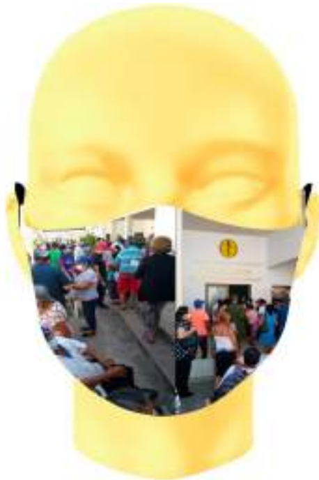
Imagen 12. Boceto digital de mascarilla sublimada -Aglomeración de adultos mayores.

Para iniciar la edificación de la obra artística se analizaron y unificaron las opciones anteriores y así poder cumplir con el objetivo de nuestro trabajo el cual consta de la utilización de varias mascarillas sublimadas que muestran los sucesos del covid en las diferentes provincias, las cuales reflejan como la salud educativa es de suma importancia ante esta grave situación.