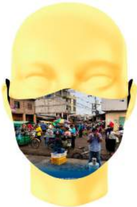
Imagen 14. Boceto digital de mascarilla sublimada -Comercio informal sin medidas de Bioseguridad en el mercado de Machala.