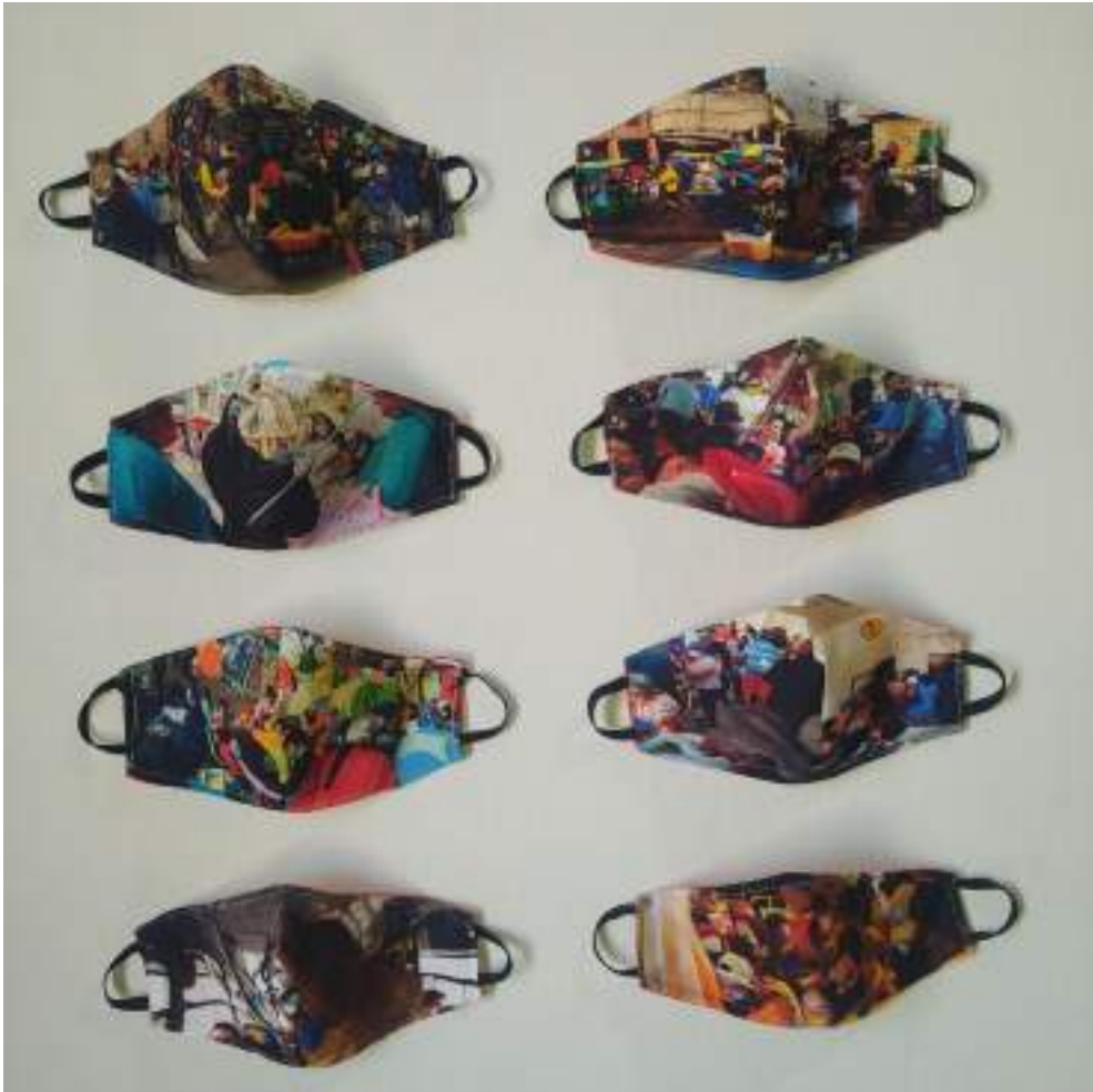
Imagen 24. Obra finalizada