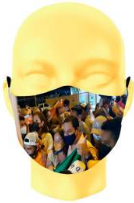
Imagen 13. Boceto digital de mascarilla sublimada - Aglomeración en Campañas políticas.