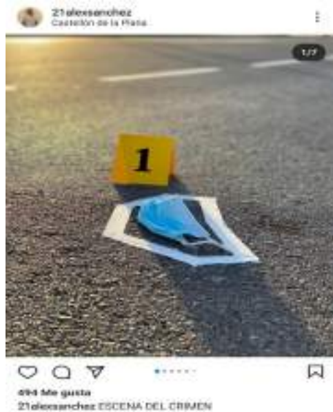
Imagen 6, Escena del crimen- Alex Sanchez-2020.