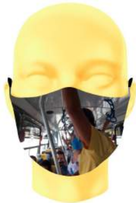
Imagen 16. Boceto digital de mascarilla sublimada -Medio de transporte irrespetando el Aforo de personas.