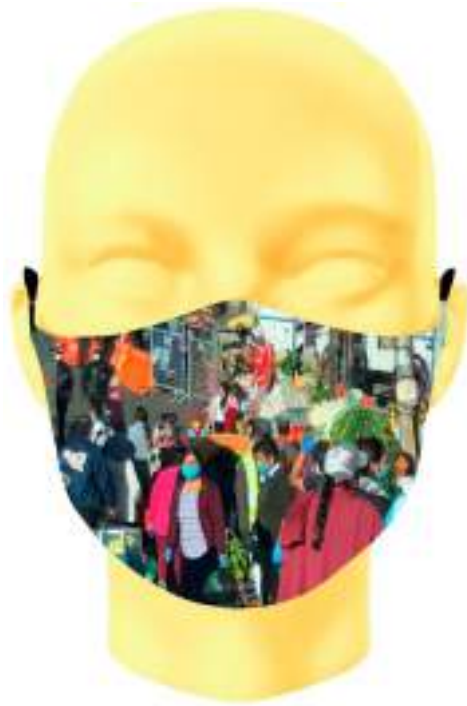
Imagen 15. Boceto digital de mascarilla sublimada -Comercio informal sin medidas de Bioseguridad en el mercado de San Roque - Quito.