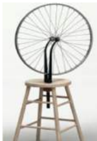
Imagen 1, Rueda de bicicleta-El primer Ready made-1913. Marcel Duchamp

El primer Ready made fue realizado por el polémico artista Marcel Duchamp, el cual escogió un objeto común y corriente como lo es una rueda de bicicleta que no tenía nada referente al arte y le dio un significado artístico causando mucha disputa en el ámbito académico ya que lo consideraban una burla al momento de plasmar este objeto como una obra de arte. Cabe destacar que con dicha obra de arte se dio inicio al arte objeto (Vargas, 2008)