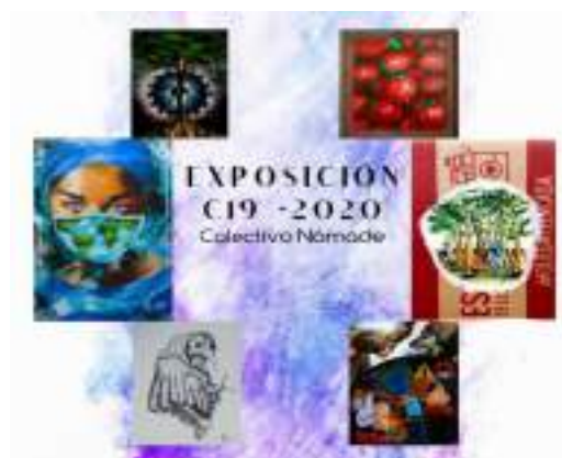
Imagen 7. Portada de la Exposición "C19-2020"

El grupo denominado Nómade conformado por 18 estudiantes universitarios de la carrera de artes plásticas de la Utmach de El Oro llevo a cabo la exposición denominada C19-2020, en el cual se destaca una ardua labor ejecutada por dicho grupo, ya que su obra fue enfocada a la actual sociedad en donde se hace un llamado a la reflexión sobre lo que está aconteciendo en esta pandemia que estamos viviendo.