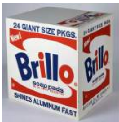
Imagen 4, Brillo Soap Pads Box-1964.Andy Warhol.