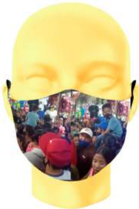
Imagen 18. Boceto digital de mascarilla sublimada - Aglomeración de personas en la Bahía de Guayaquil.