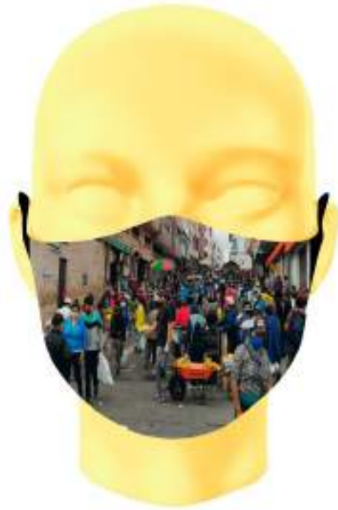
Imagen 19. Boceto digital de mascarilla sublimada - Aglomeración de personas en el mercado de Azuay.