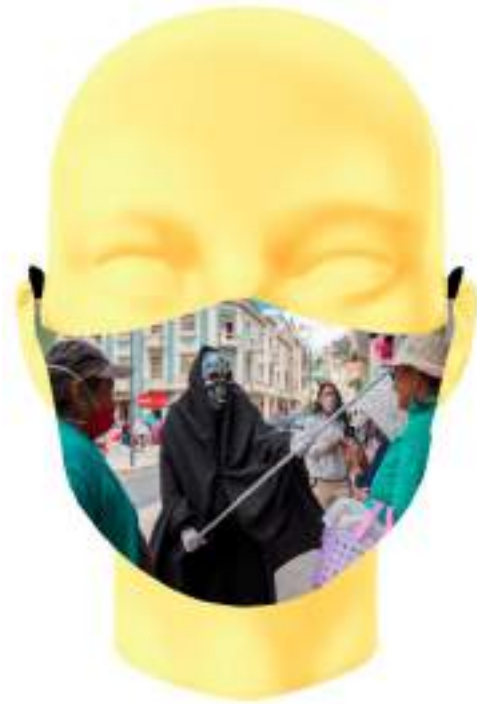
Imagen 17. Boceto digital de mascarilla sublimada - campaña relacionada a las muertes por covid-19 en la Ciudad de Loja.