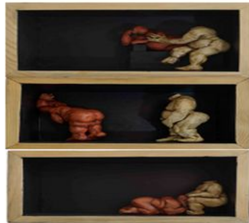
Ausubel, Jerome En: esp. 10, 1, 4, 7

* Proyecto de grado para optar por el título de Maestría en Educación.