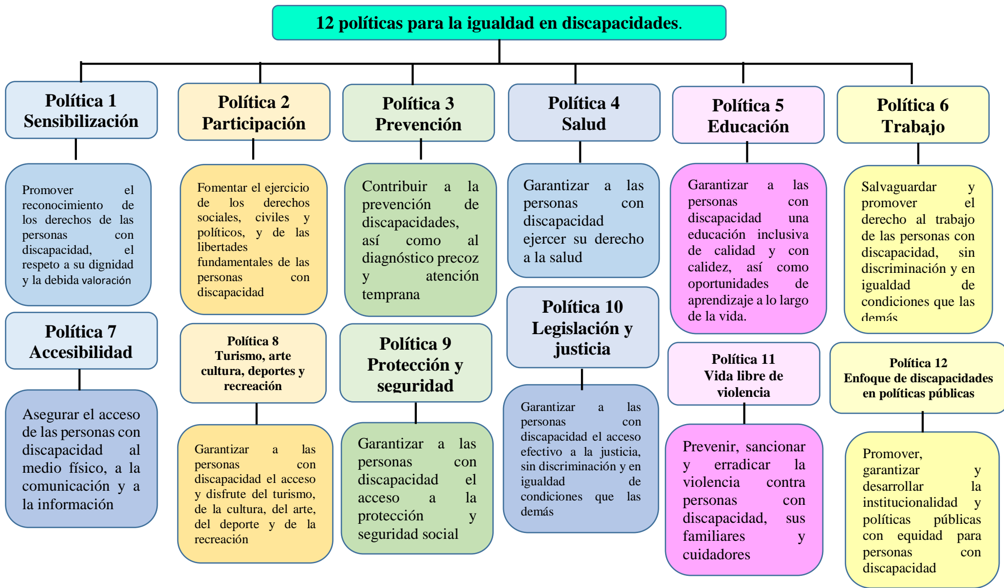
imagen 1 : 12 políticas para la igualdad en discapacidades.