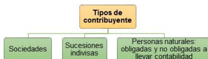
Ilustración 1: Tipo de Contribuyentes

La ley también clasifica a los contribuyentes como: