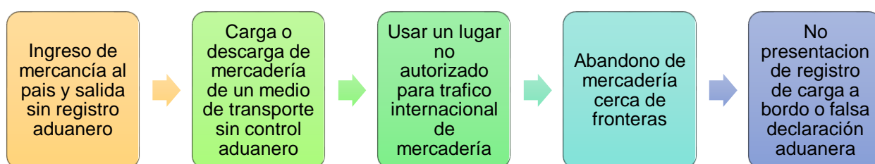
Ilustración 2. Formas de contrabando.

Las fronteras del Ecuador permanentemente están rodeadas de un gran movimiento comercial, en donde muchas veces existen problemas de incumplimiento de las leyes y evasión de impuestos. Estas infracciones han sido catalogadas como delitos aduaneros, en donde evadiendo el pago de tributos de las mercancías que ingresan o salen del país se perjudica gravemente no solo a la institución aduanera sino también a la economía nacional; el perjuicio se torna un problema social, pues alcanza a desarrollarse a tal punto de perjudicar a la población que recibe beneficios de los programas o proyectos desarrollados con la financiación de los impuestos recaudados (Velasco, 2011).