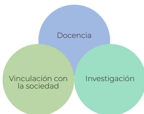
Figura 2. Articulación de los proyectos de vinculación con la sociedad

La Organización de las Naciones Unidas para la Educación, la Ciencia y la Cultura UNESCO (2009), recomienda a las universidades fortalecer las funciones de servicio a la sociedad,