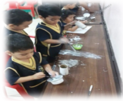
Ilustración 1.- Actividad de mezclas de colores

En la 2º imagen observamos una representación artística, utilizando técnicas donde plasma su creatividad e imaginación el niño, en la que nos manifestó que esa pintura refleja una preciosa larva naranja en un tallo café, con hojas verdes comiendo de sus hojas amarillas. Esto nos quiere decir que la creatividad imaginativa y su forma de comunicar se pueden enriquecerla con bases innovadoras y sobretodo acorde a las edades requeridas.