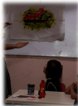
Ilustración 2.- Actividad de mezclas de colores

En la 2º imagen observamos una representación artística, utilizando técnicas donde plasma su creatividad e imaginación el niño, en la que nos manifestó que esa pintura refleja una preciosa larva naranja en un tallo café, con hojas verdes comiendo de sus hojas amarillas. Esto nos quiere decir que la creatividad imaginativa y su forma de comunicar se pueden enriquecerla con bases innovadoras y sobretodo acorde a las edades requeridas.