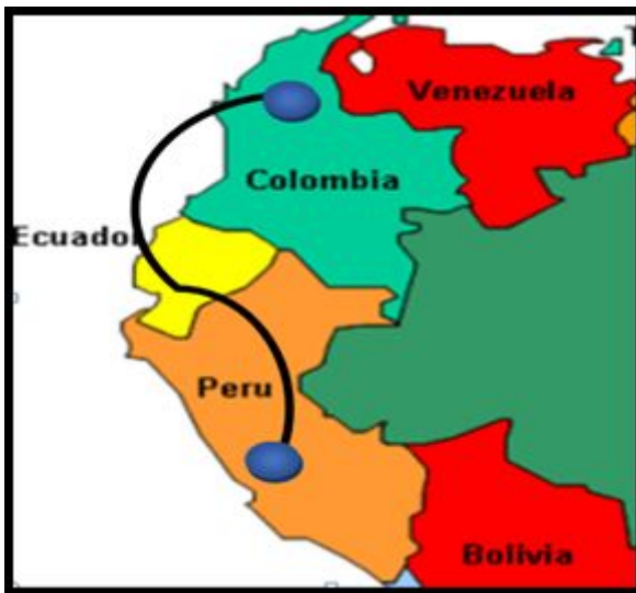
Ilustración 1: MAPA DE RUTA DEL RÉGIMEN DE TRANSPORTE INTERNACIONAL COMUNITARIO

Al mismo tiempo, la aduana de partida colombiana le notifica mediante “Aviso de partida” utilizando el buzón a cargo de Directores de Despacho o zona primaria y a Jefes de zona primaria, las operaciones de transporte a Ecuador como frontera de paso y a Perú país de destino.