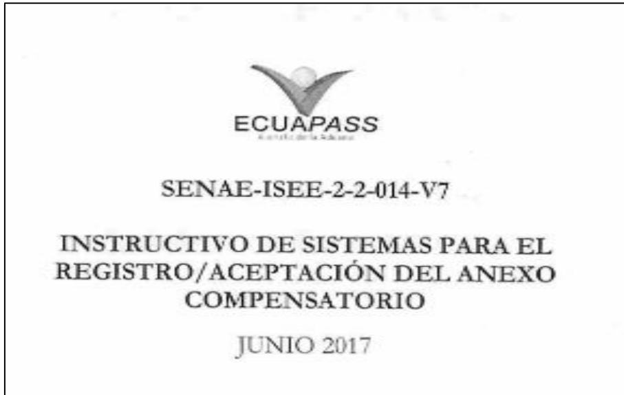
Cuadro 3 Referenciado por el Autor